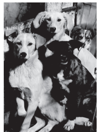
ЩЕНКИ. Возраст от 3х месяцев, есть крупные, есть мелкие породы