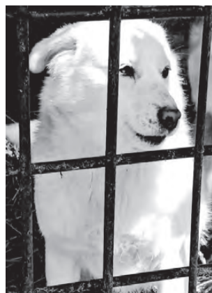
СНЕЖКА. Мелкая собачка, ласковая умница, послушная