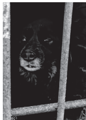
ШАРИК. Толстенький, лохматый, очень умный, послушный