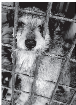
МАЛЫШ. Маленький, спокойный пёсик, подойдет для двора

В городе Реж в пункте кратковременного содержания безнадзорных животных находятся собаки и кошки, готовые обрести дом и любящих хозяев. Животные прошли ветеринарный карантин, поставлены необходимые прививки. Есть щенки и котята, возраст от 1 месяца до года. Если Вы хотите обрести друга и надежного охранника, звоните по телефону 8-912-674-23-28 . Мы можем доставить вам понравившееся животное. Уважаемые режеляне, если у вас есть возможность помочь кормом для животных, то мы с радостью примем крупы (кроме перловой - ее собакам нельзя), макаронные изделия, кости, лапки кур, хлеб, сухари, сухой корм. Заранее огромное всем спасибо.