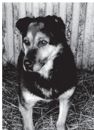
ГЕРДА. Крупная, стерилизованная, спокойная, хорошая охрана