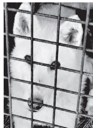
БЕЛЯШ. Лайка, крупный, очень активный, приучен к вольеру