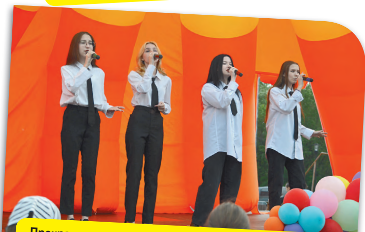
Прекрасные творческие номера в исполнении артистов ДК «Металлург» дарили всем хорошее настроение