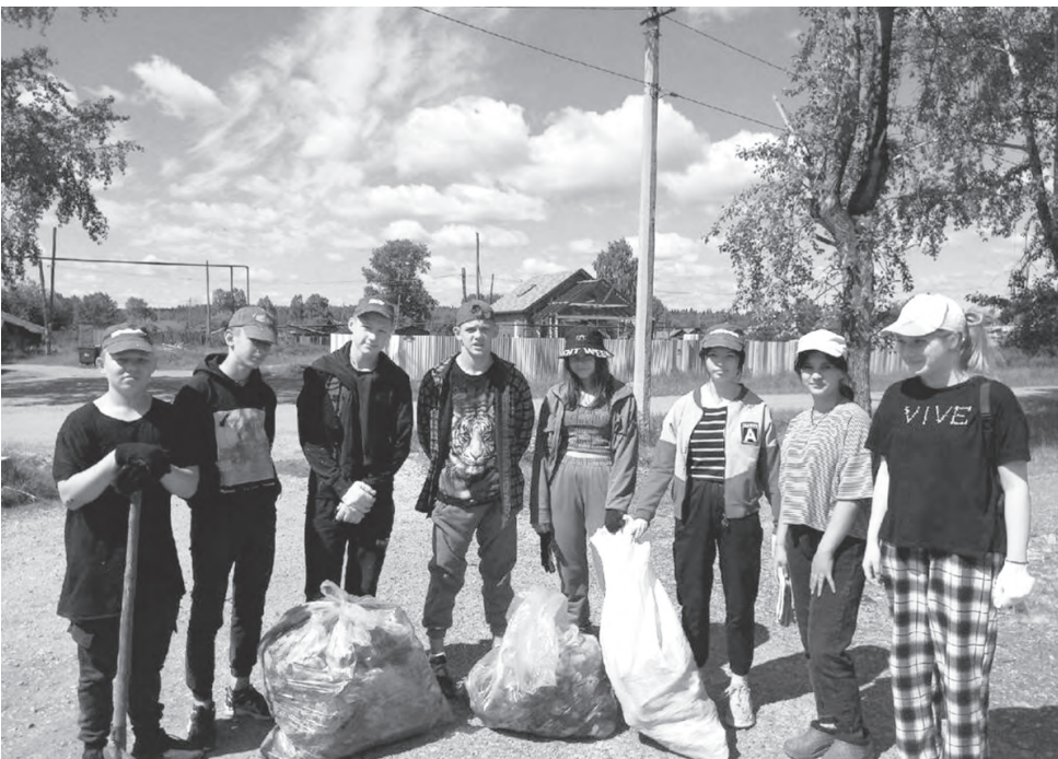
Отряд «Одуванчики» ПМК «Радуга»