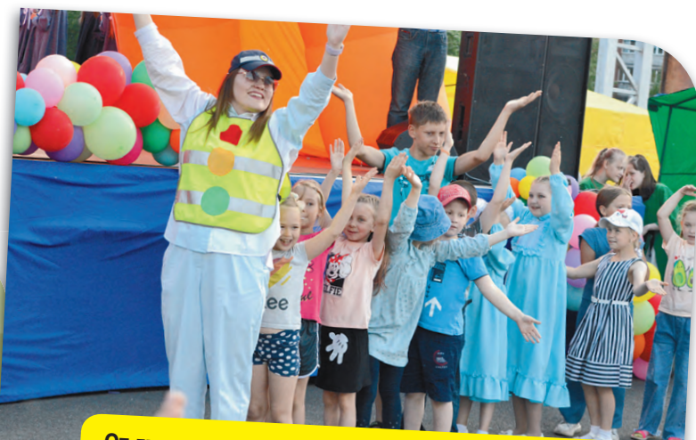
От души веселились на празднике и маленькие красноуральцы