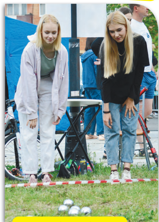
Поиграть в бочке любят все