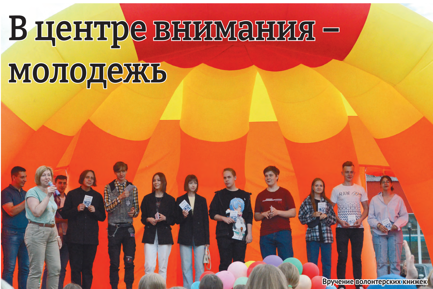
Вручение волонтерских книжек

Молодости всегда присущи размах и безудержное веселье, поэтому День молодежи в Красноуральске прошел ярко и был наполнен особой энергетикой. Организаторы праздника Управление культуры и молодежной политики, ДК «Металлург» постарались порадовать жителей и гостей города разнообразными играми и конкурсами, веселыми песнями и зажигательными танцами.