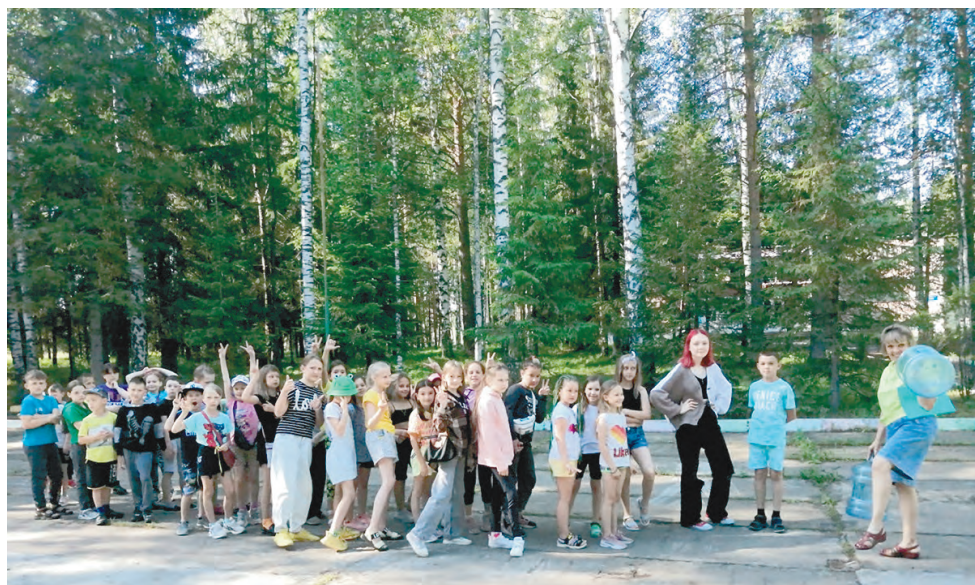
Вторая смена в лагере «Солнечный»