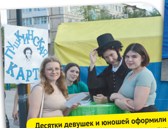
Десятки девушек и юношей оформили «Пушкинскую карту» прямо на празднике

Праздничная программа, которая проходила в минувшую пятницу в сквере по ул. Ленина, собрала всех, кто молод душой и готов поделиться своим хорошим настроением с другими.