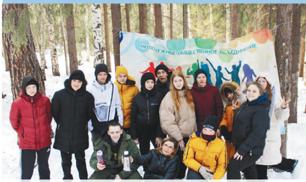
Развитие потенциала молодежи