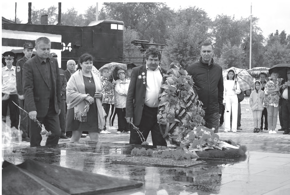
Возложение цветов и венков к Вечному огню

Курсанты военно-патриотического клуба «Барс» стояли в почетном карауле под дождем навтыжку, олицетворяя стойкость русского солдата.