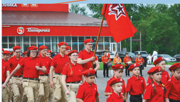
Патриотическое воспитание граждан