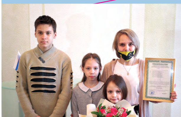
Поддержка молодых семей