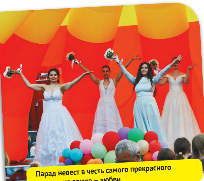
Парад невест в честь самого прекрасного чувства на земле – любви