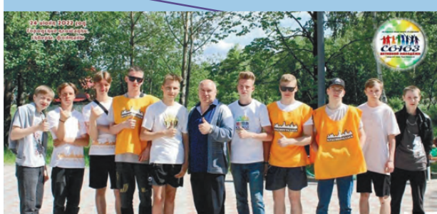
Популяризация здорового образа жизни среди молодежи

Праздничная программа, которая проходила в минувшую пятницу в сквере по ул. Ленина, собрала всех, кто молод душой и готов поделиться своим хорошим настроением с другими.