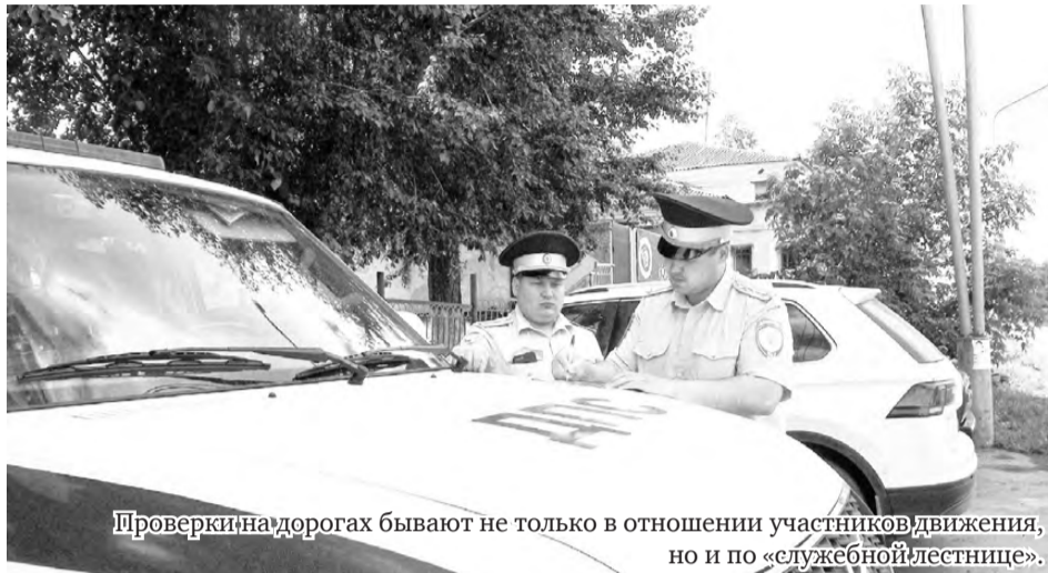
Проверки на дорогах бывают не только в отношении участников движения, но и по «служебной лестнице».