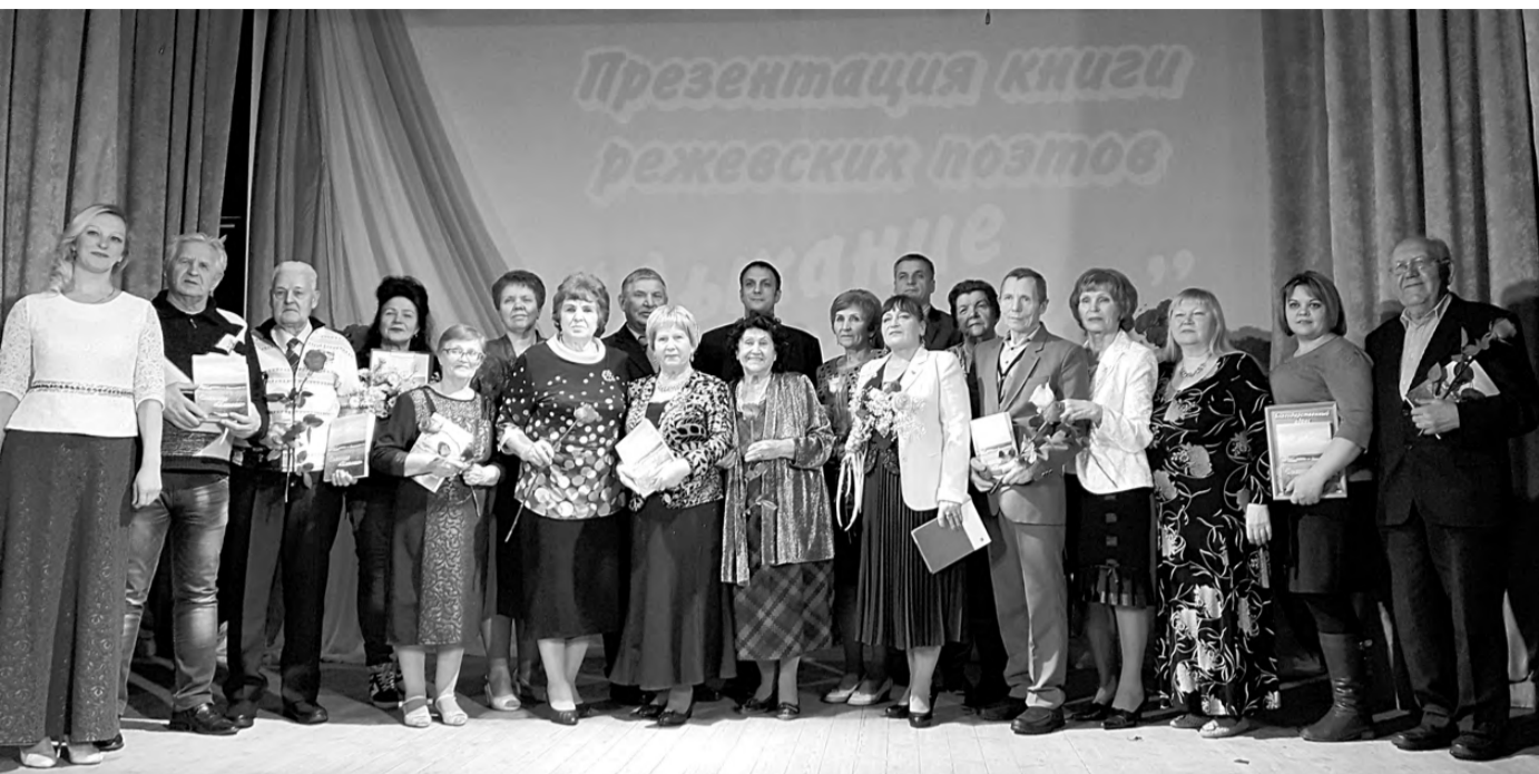
Общее фото на память о замечательном событии.

Так называется новый поэтический сборник режевских поэтов, презентация которого прошла 23 ноября в Центре культуры и искусств.