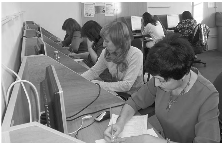
Первый этап - тестирование.