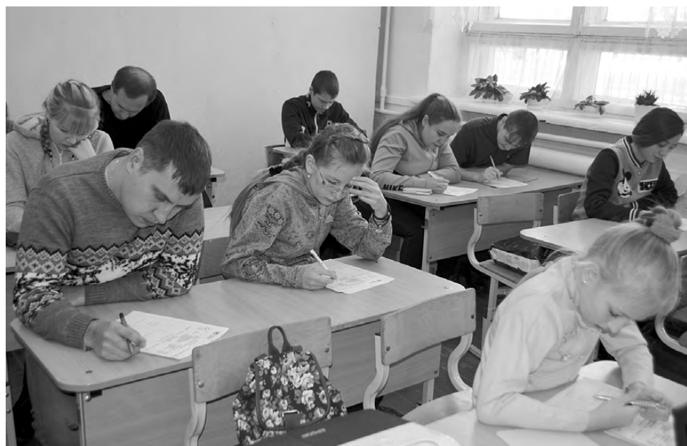
Все желающие могли написать географический диктант в режиме онлайн на сайте Русского географического общества.

Действительно, задания были видны не только на бумаге, но и на экране проектора. Каждое воспроизводилось с помощью