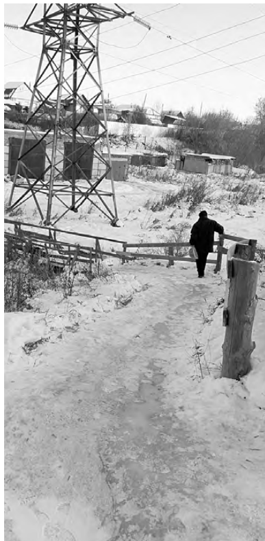
... и утром в среду.

В ноябрьские морозы на улице Фрунзе произошла коммунальная авария. Вода бежала к лугу. Мороз быстро делал своё дело, образуя из воды настоящую ледяную катушку.