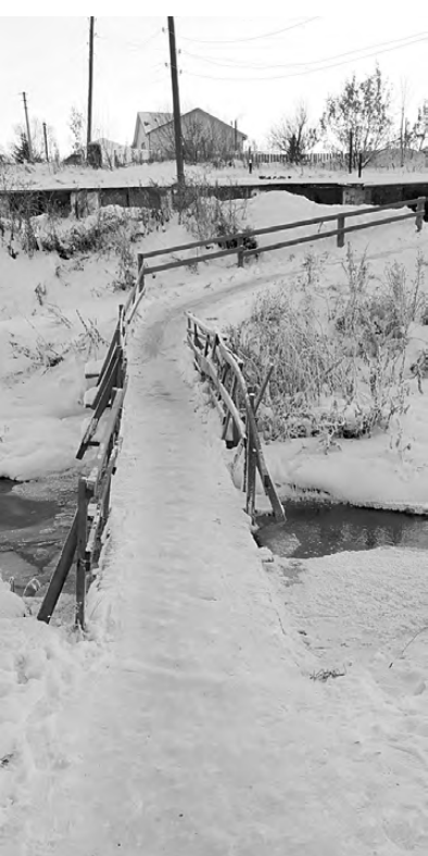
Дорога к мостику и через него в конце прошлой недели...