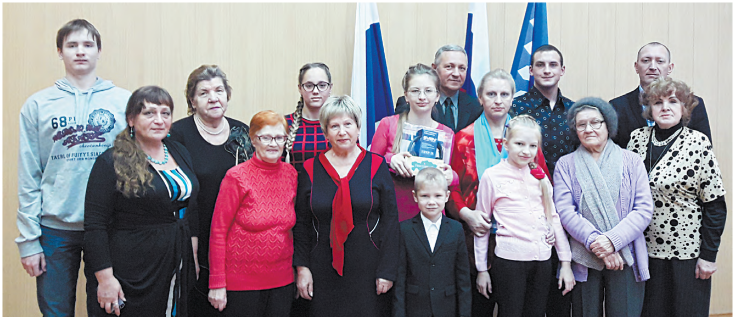
Общее фото на память.