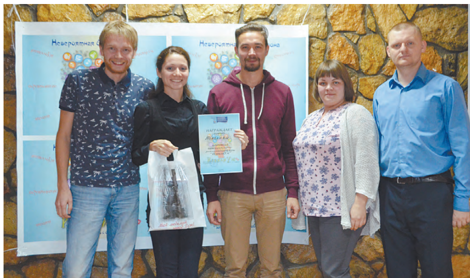
«Молорики» оправдали своё название!