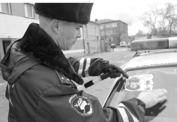
Стикер с лозунгом «Работайте, братья!» появился на стёклах полицейских автомобилей.

полицейским мужеством и отвагой Президент России Владимир Путин вручил 22 сентября в Москве родителям Магомеда Нурбагандова звезду Героя России.