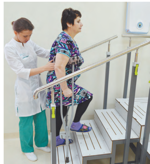
Период реабилитации в центре проходит под наблюдением специалистов.