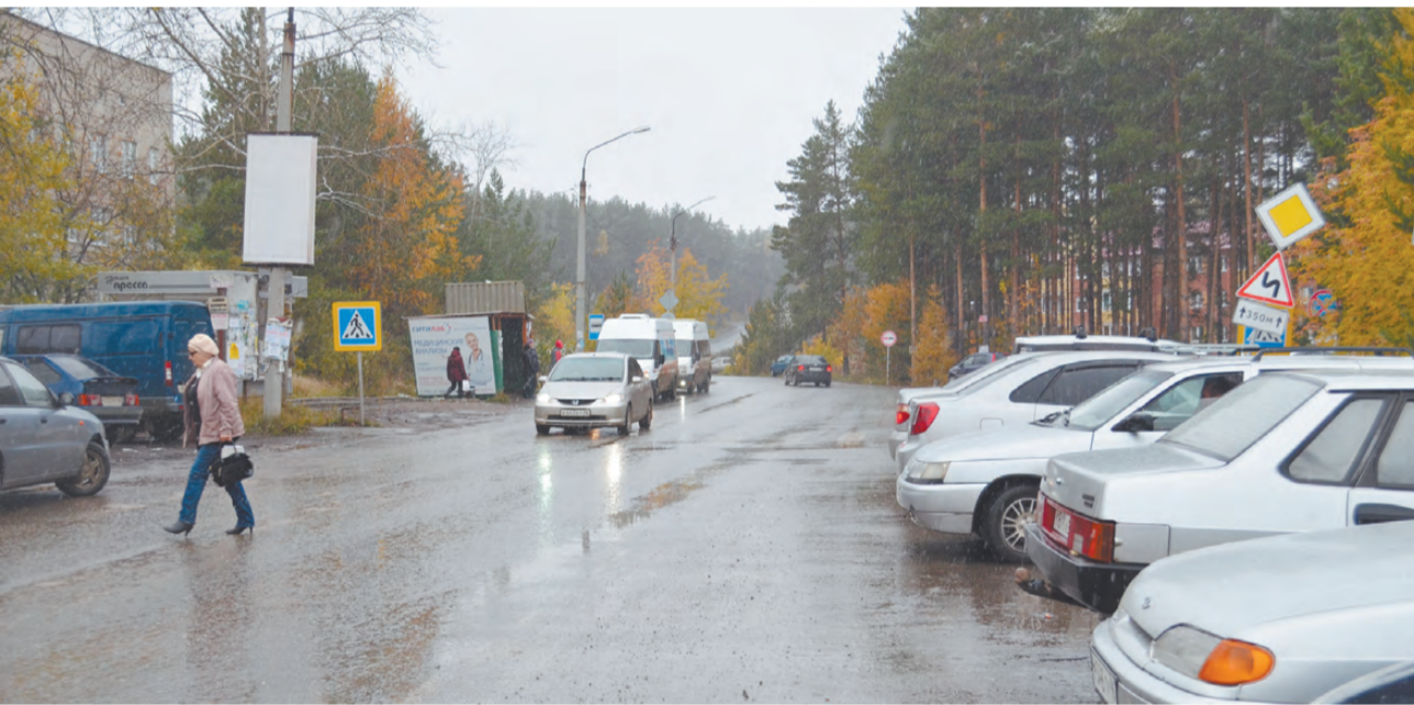
«Зебру» у ЦРБ опасно переходить и в светлое время. Выход на неё с одной стороны загораживает парковка автомобилей. Водители могут не успеть вовремя заметить появившегося из-за машин пешехода.

Отсутствие освещения на пешеходном переходе возле Режевской ЦРБ стало поводом для коллективного обращения к главе РГО, руководству ОГИБДД и в СМИ 60-ти работников дома-интерната. 4 октября в 19.55 сотрудницы интерната, выйдя в темноте на «зебру», чуть не попали под машину.