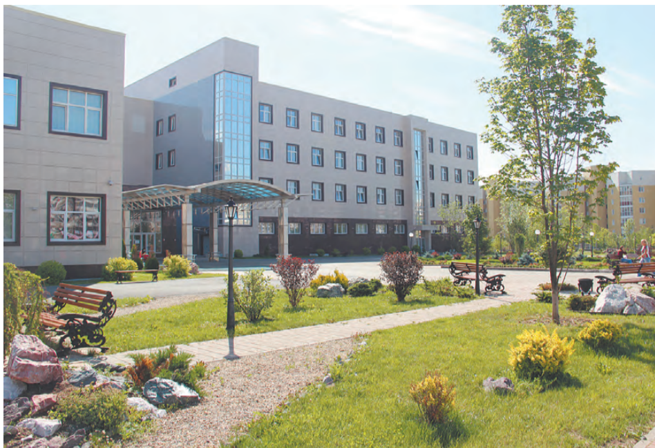
Уральский клинический лечебно-реабилитационный центр в Нижнем Тагиле. Ведущие западные хирурги, которые проводят здесь мастер-классы, высоко оценили уровень профессионализма тагильских врачей.

- Наш центр работает в системе обязательного медицинского страхования, в рамках которой оплачивается специализированная, в том числе высокотехнологичная медицинская помощь, например, эндопротезирование тазобедренных суставов. Заключён государственный контракт с Министерством здравоохранения Свердловской области на выполнение операций по эндопротезированию коленных суставов и операции на позвоночнике. Всего в год мы проведём более 2000 бесплатных для пациентов операций на опорно-двигательном аппарате, хотя технических возможностей для выполнения госзадания гораздо больше. Потенциальная мощность центра -