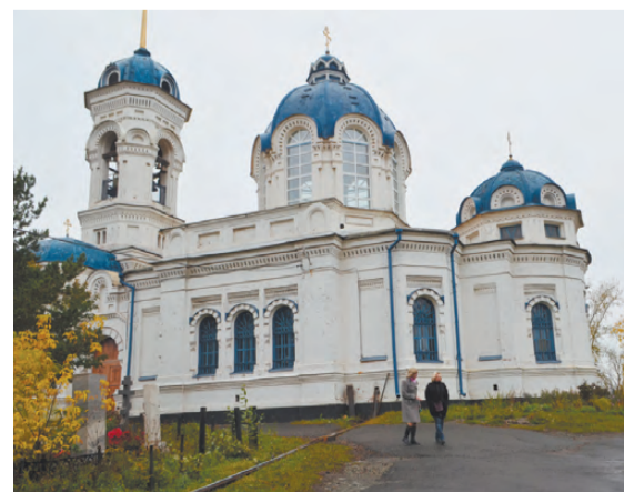
Иоанно-Предтеченская церковь построена в 1902 году в русско-византийском стиле.