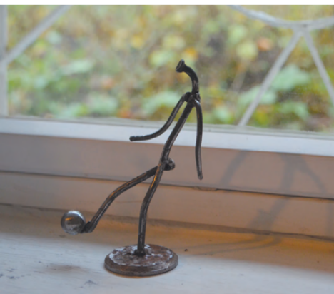
Экспонат выставки «Мастер Гвоздь» воплотил тему спорта и предстоящего события - чемпионата мира по футболу-2018.

Совсем другим предстаёт наш Реж, когда смотришь на него из окна экскурсионного автобуса. Здания, которые раньше казались несовременными, скучными и надоевшими, предстали в совершенно новом свете. Стоит только прислушаться к словам экскурсовода: