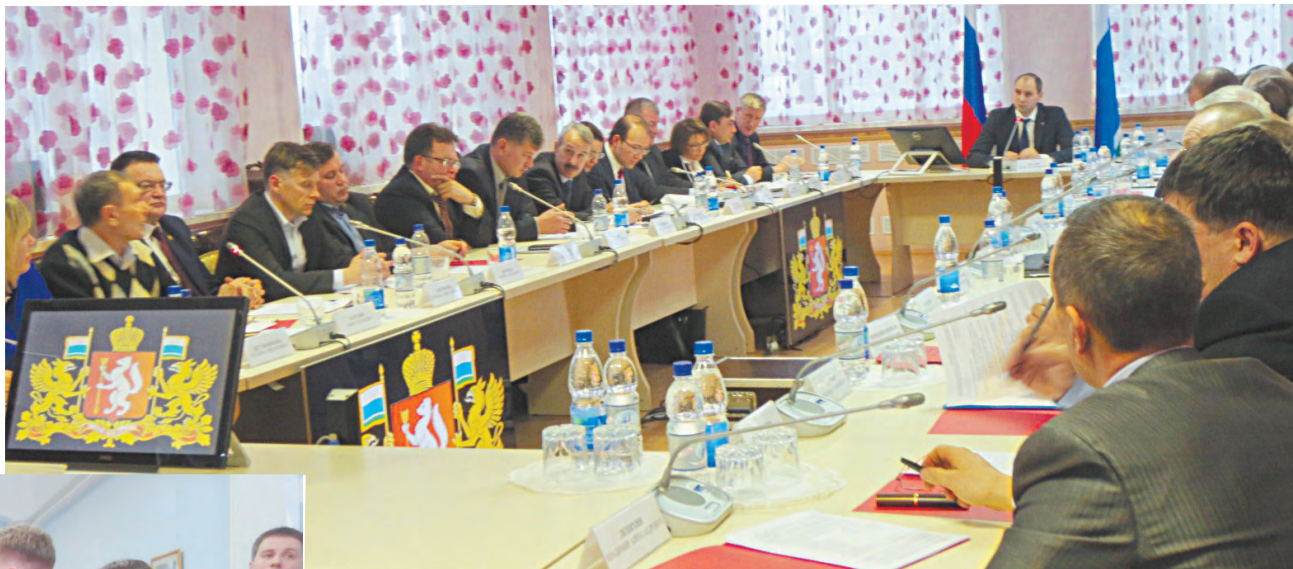
Заседание кабинета министров прошло в санатории «Обуховский».