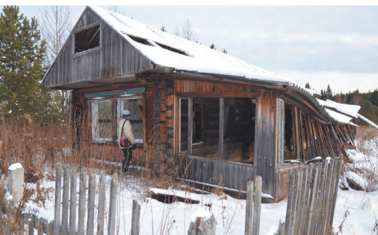
Галанино в наши дни.

Подготовила Арина АГАПОВА.