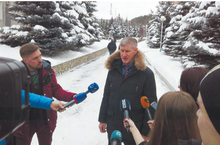
На многочисленные вопросы журналистов ответил министр агропромышленного комплекса и продовольствия М. Копытов.