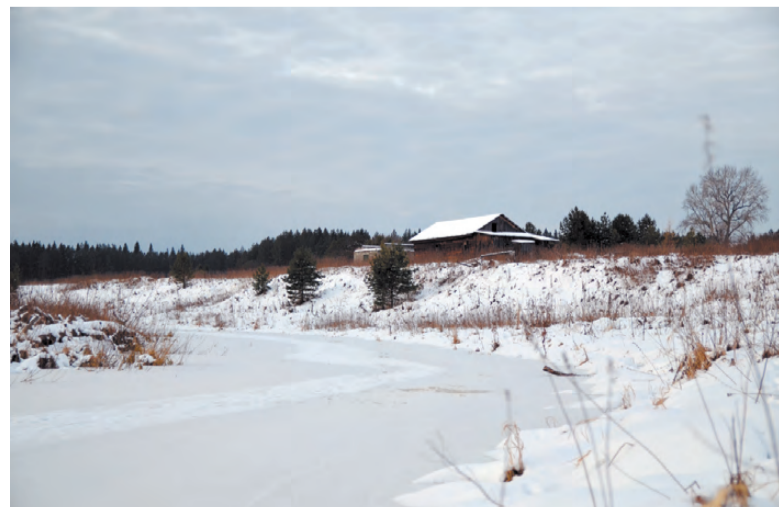
Деревня располагалась в живописном уголке нашего района.