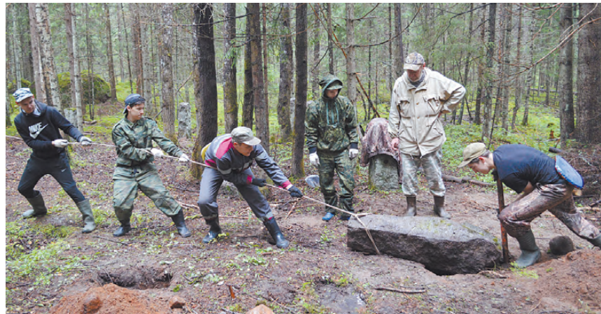
Обустройство кладбища времён финской войны. Ребята поднимают упавшие гранитные стойки, служившие ограждением.