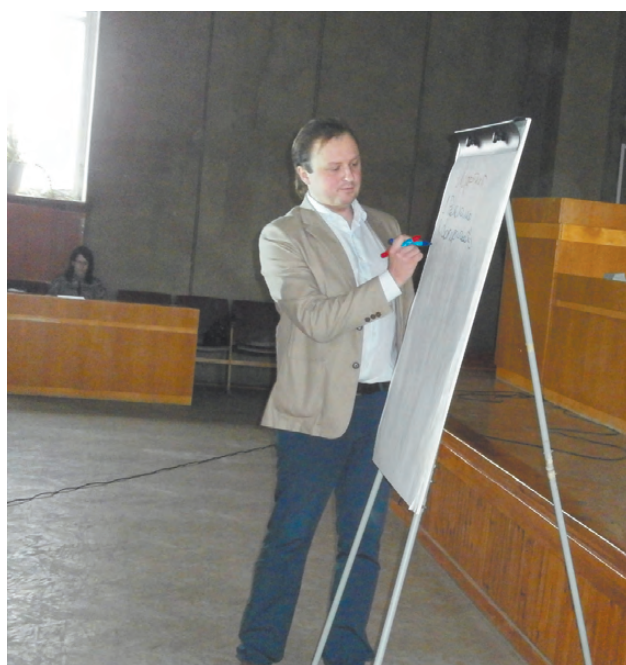
Занятие ведёт бизнес-тренер из Екатеринбурга.

Проект будет реализовываться в три этапа. На первом этапе для школьников и студентов мы пригласили бизнес-тренеров из Екатеринбурга, которые проводят занятия по теме «Предпринимательство и бизнес-планирование». На втором этапе мы организуем бизнес-экскурсии