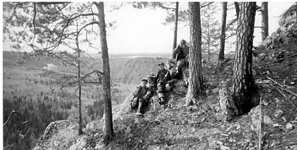
На реке Чусовой с друзьями.