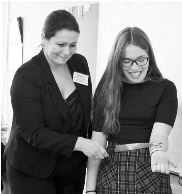
Химия – на службе кинематографа: с помощью химических веществ имитируются раны. В ходе эксперимента пострадавших нет.