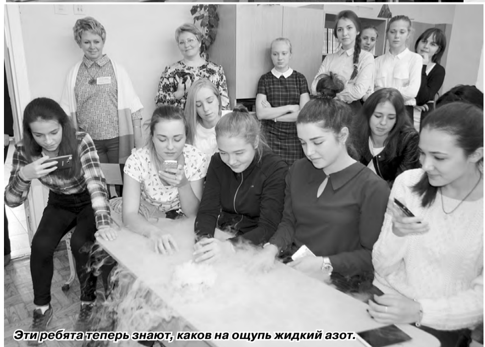
Эти ребята теперь знают, каков на ощупь жидкий азот.