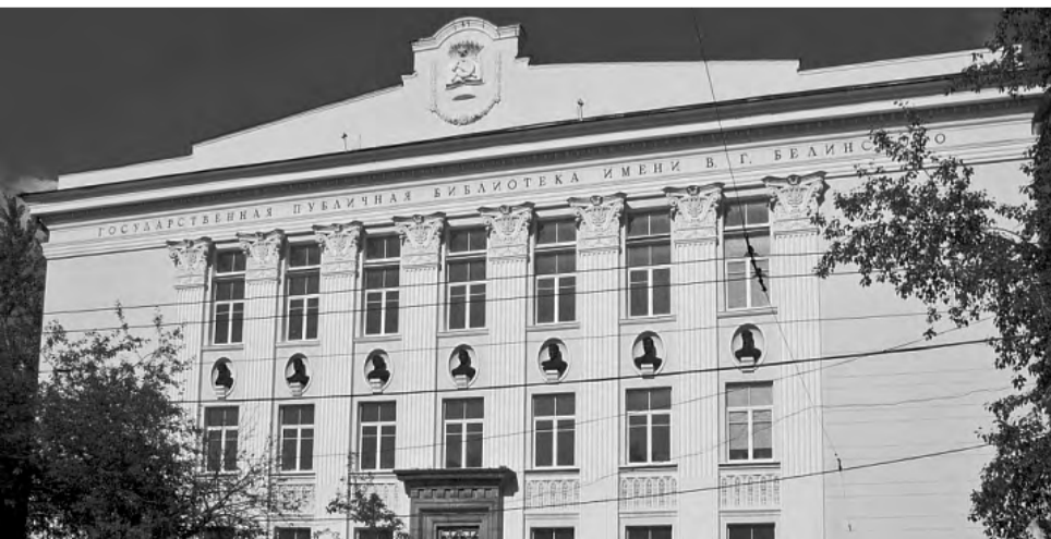
Библиотека Белинского, фасад которой украшают лепные работы братьев Постоноговых.

Подготовила Людмила НИКОНОВА.