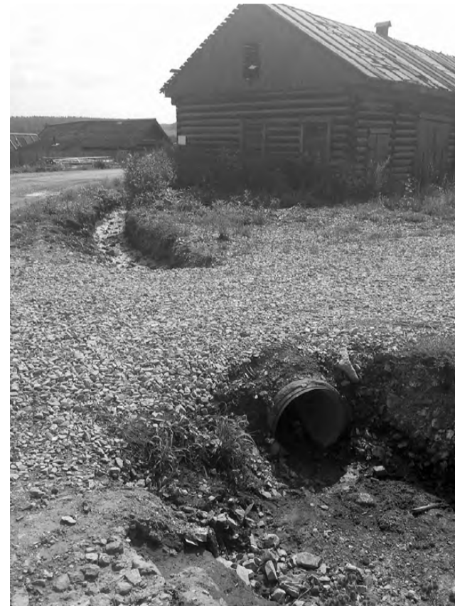
Канава должна помочь в отводе воды с низкого участка села.