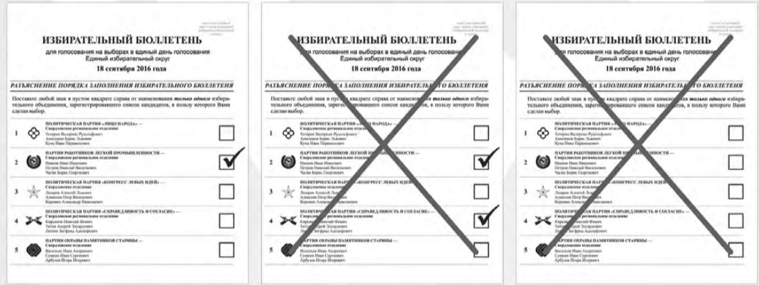
Эти бюллетени заполнены неправильно и являются недействительными