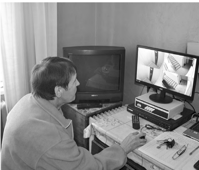
Лифтоёр видит всё, что происходит в кабине лифта и возле него.

Для защиты лифта от вандалов и хулиганов установлена система видеонаблюдения и в самой кабине, и на первом этаже. Данные с видеокamer в режиме онлайн просматривает лифтоёр. Причем, на монитор картинка передаётся одновременно из