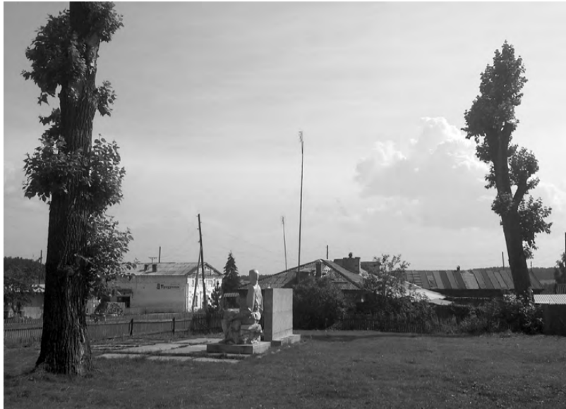
Тополя-переростки больше не угрожают безопасности людей.