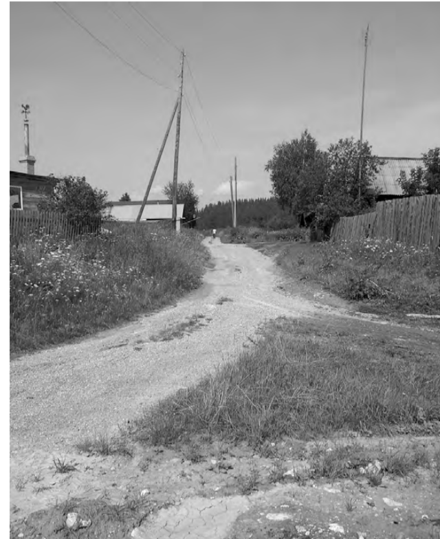
Деревенские дороги отсыпаются и профилируются.