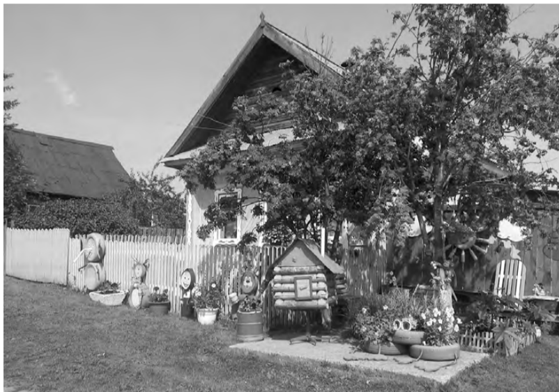
Дом-сказка в Октябрьском.