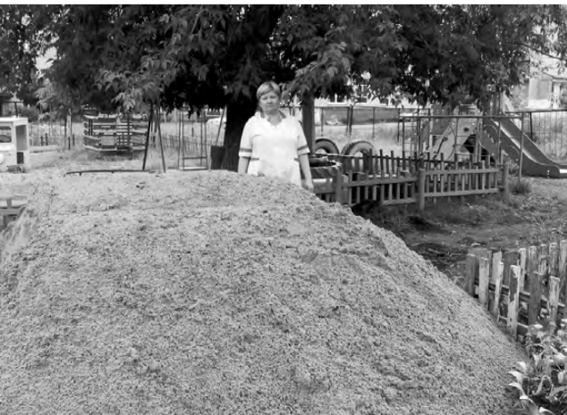
Завезён и песок для детского сада.