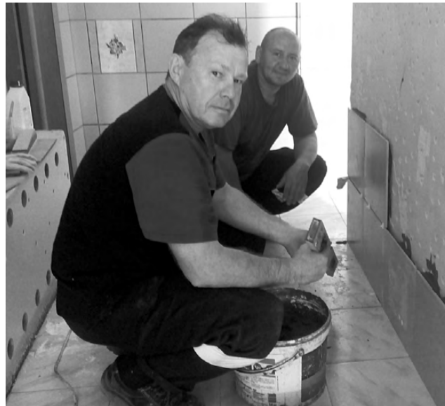
Идут работы по замене плитки.

Рабочие бригады этой организации (очень приятно, что один из работников – бывший воспитанник детского сада) отремонтировали ограждение по всему периметру детского сада, уложили кафельную плитку в холле, устранили течь в подвале, отремонтировали два входных крыльца, подняли и залили ступени запасной пожарной лестницы, привезли в детский сад песок. Это малая часть той работы, которая была проведена. В настоящее