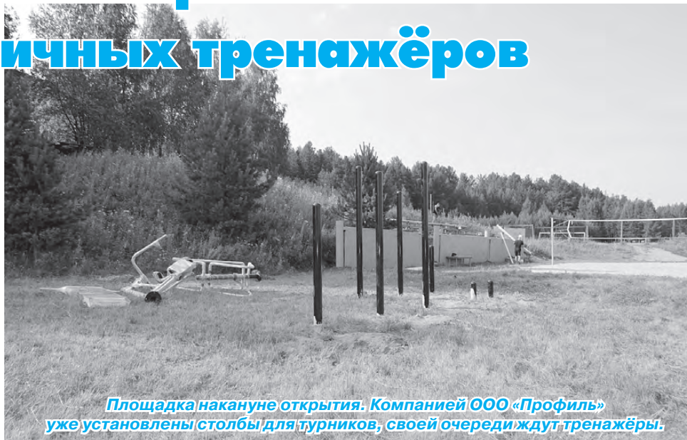
Площадка накануне открытия. Компанией ООО «Профиль» уже установлены столбы для турников, своей очереди ждут тренажёры.