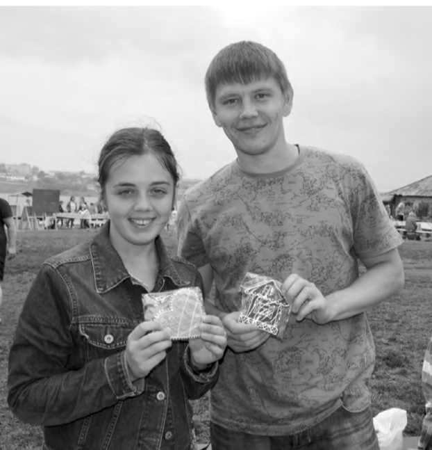
Желающих отведать произведение кулинарного искусства нашлось немало, в общем, архангельские пряники разошлись как горячие пирожки.