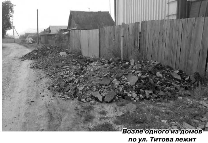
Возле одного из домов по ул. Титова лежит грунт, очень похожий на тот, что вывозят с улицы Ленина.