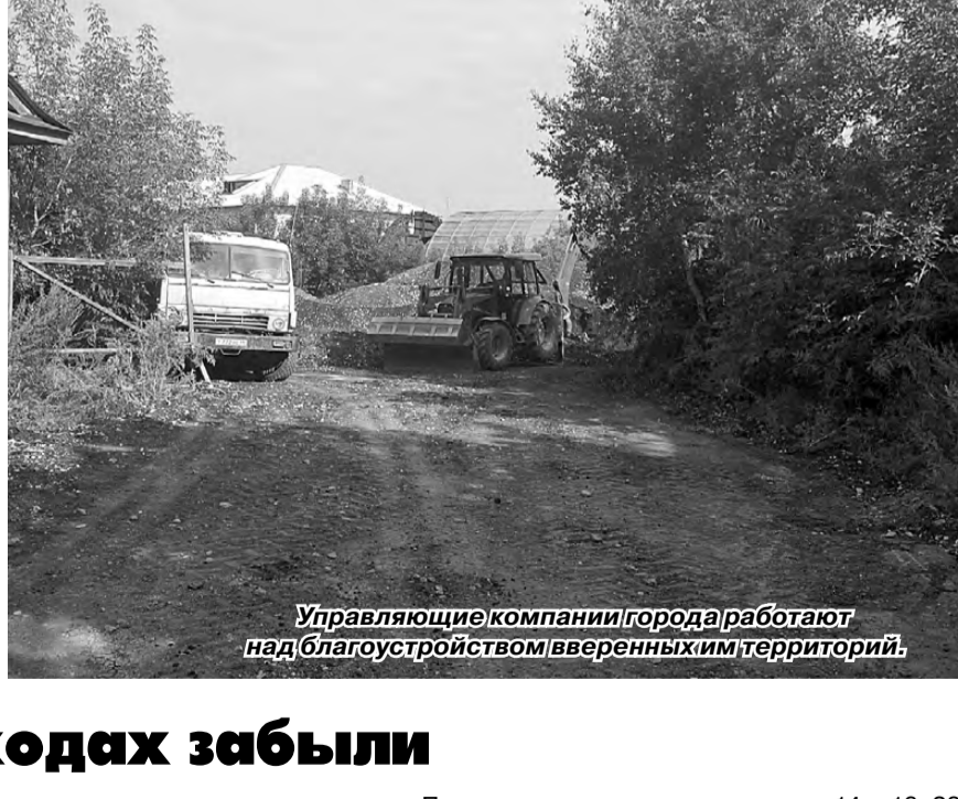
Управляющие компании города работают над благоустройством вверенных им территорий.