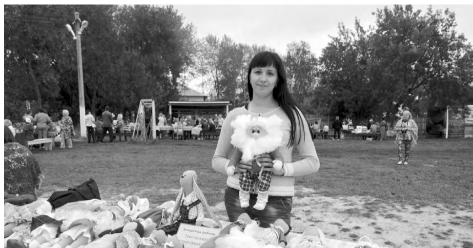
Артёмовские умельцы не отстают в мастерстве от режевских.