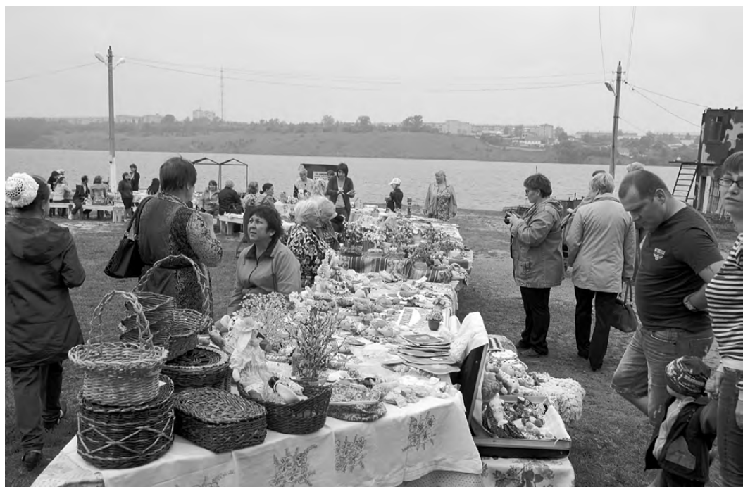
Выставка проходила в формате Open Air (на свежем воздухе).