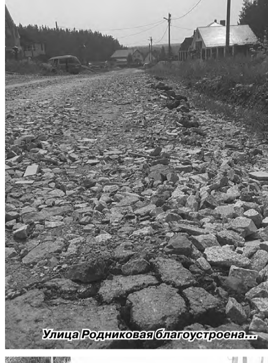
Улица Родниковая благоустроена...