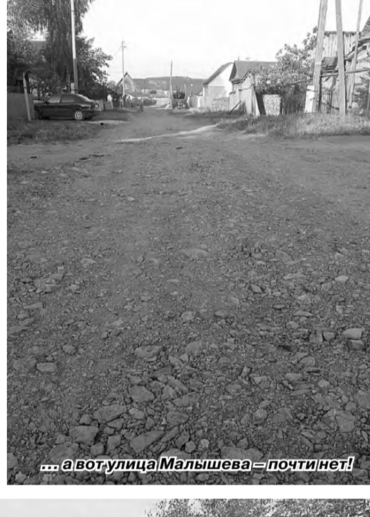
... а вот улица Малышева – почти нет!