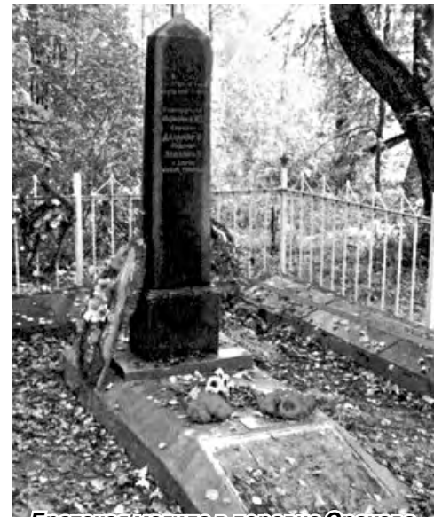
Братская могила в деревне Орехово Режевского района Тверской области, в которой захоронены уральцы из 375 стрелковой дивизии.