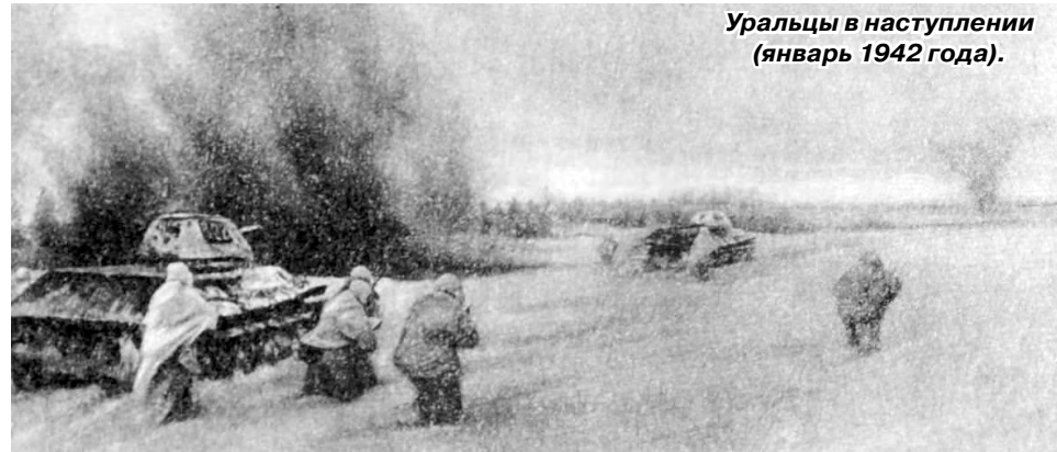
Уральцы в наступлении (январь 1942 года).