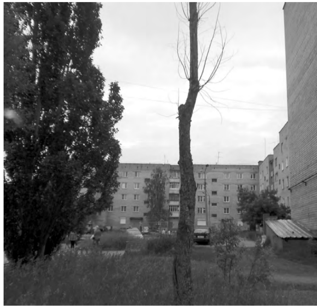
Рядом с этим погубленным тополем ещё 7 таких скелетов – дело рук УК «Реж».