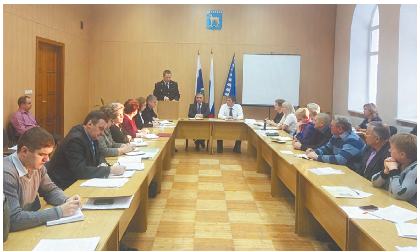
Аппаратное совещание в администрации РГО.