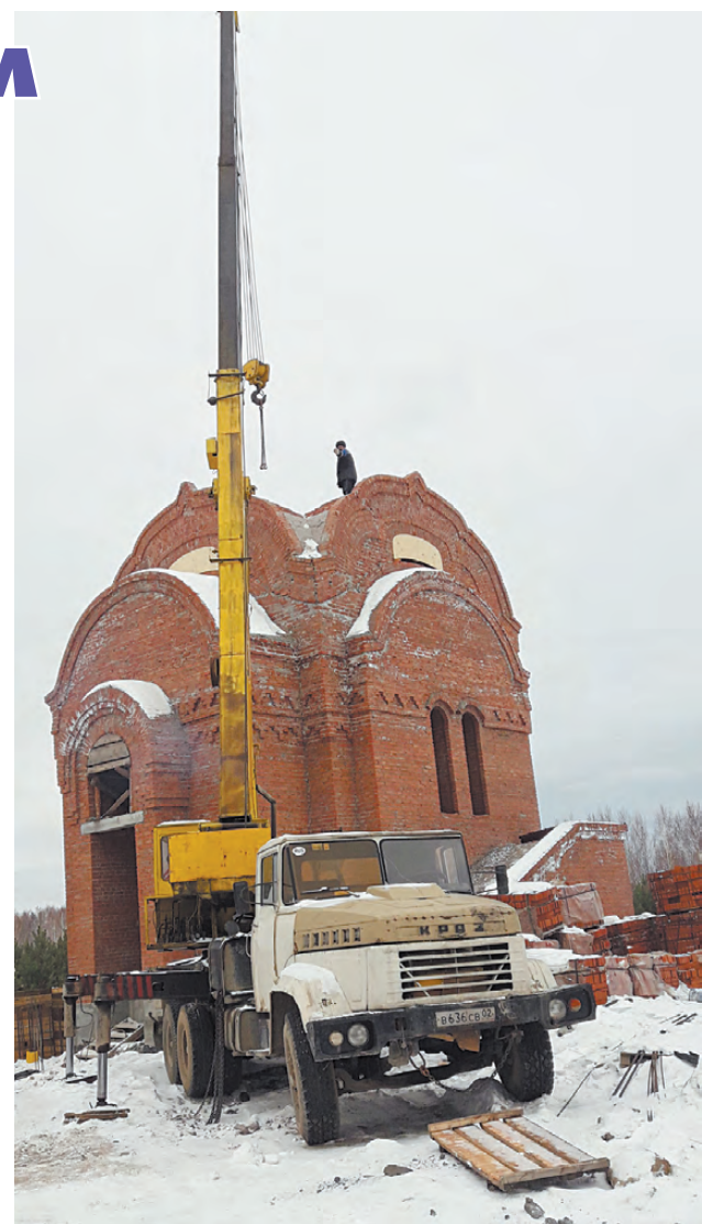
Строительство храма во имя святителя Николая Чудотворца близко к завершению.

Пожертвования на строительство храма также можно приносить и в редакцию газеты «Режевская весть» (ул. Красноармейская, д. 5), где для этих целей установлен специальный ящик.