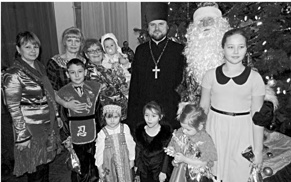
На Рождественской ёлке царила праздничная, тёплая, дружеская атмосфера.

Во всех городских и сельских приходах Режевского благочиния прошли праздничные рождественские мероприятия: детские утренники, спектакли и концерты.