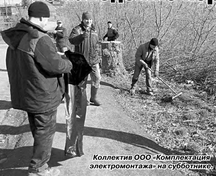
Коллектив ООО «Комплектация электромонтажа» на субботнике.

С подведения итогов месячника по санитарной очистке и благоустройству Режевского городского округа, который завершился 13 мая, началось аппаратное совещание в администрации округа.