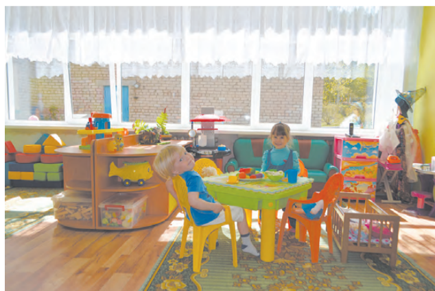
После замены окон в группах д/с «Лесная полянка» стало уютнее.