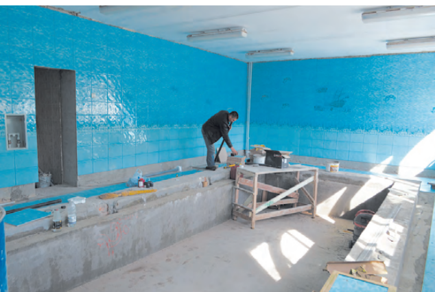
Осенью детсадовцы «Голубого кораблика» смогут наслаждаться купанием в обновлённом бассейне.