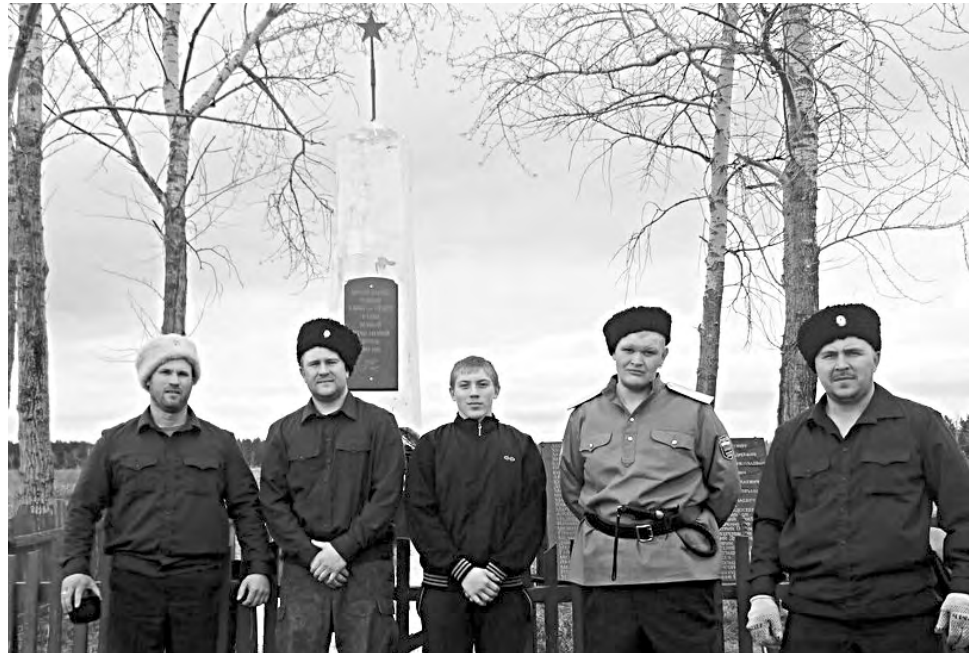
9 мая казаки вернутся к обелиску в Новых Кривках, чтобы возложить к его подножию гирлянду и венки.

- Мы были приятно удивлены тем, что в нашем районе идёт не только восстановление памятников, но и установка новых,