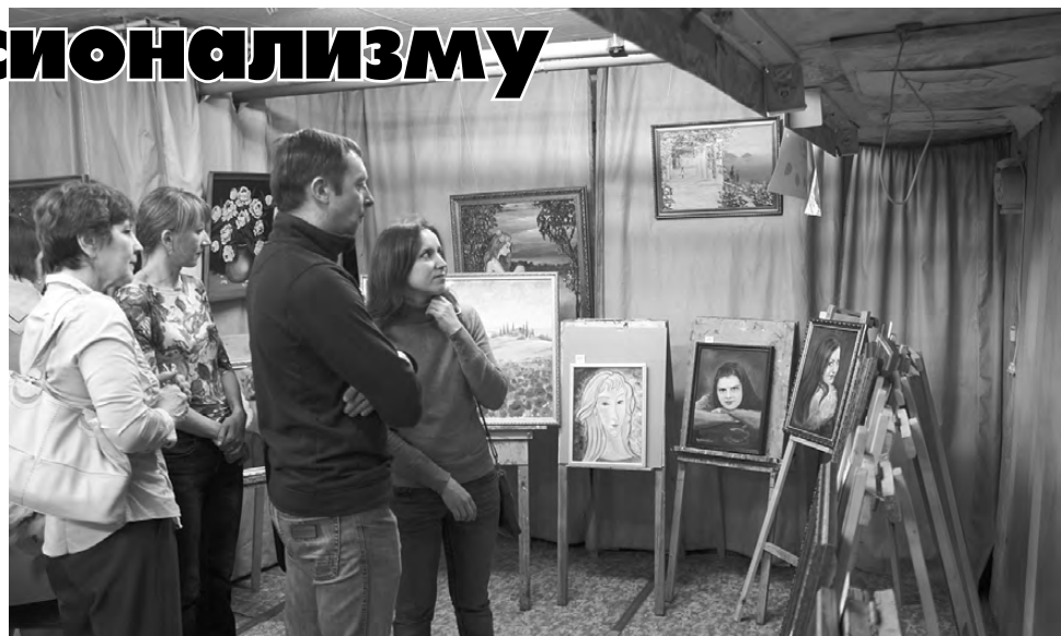
На выставке в студии.