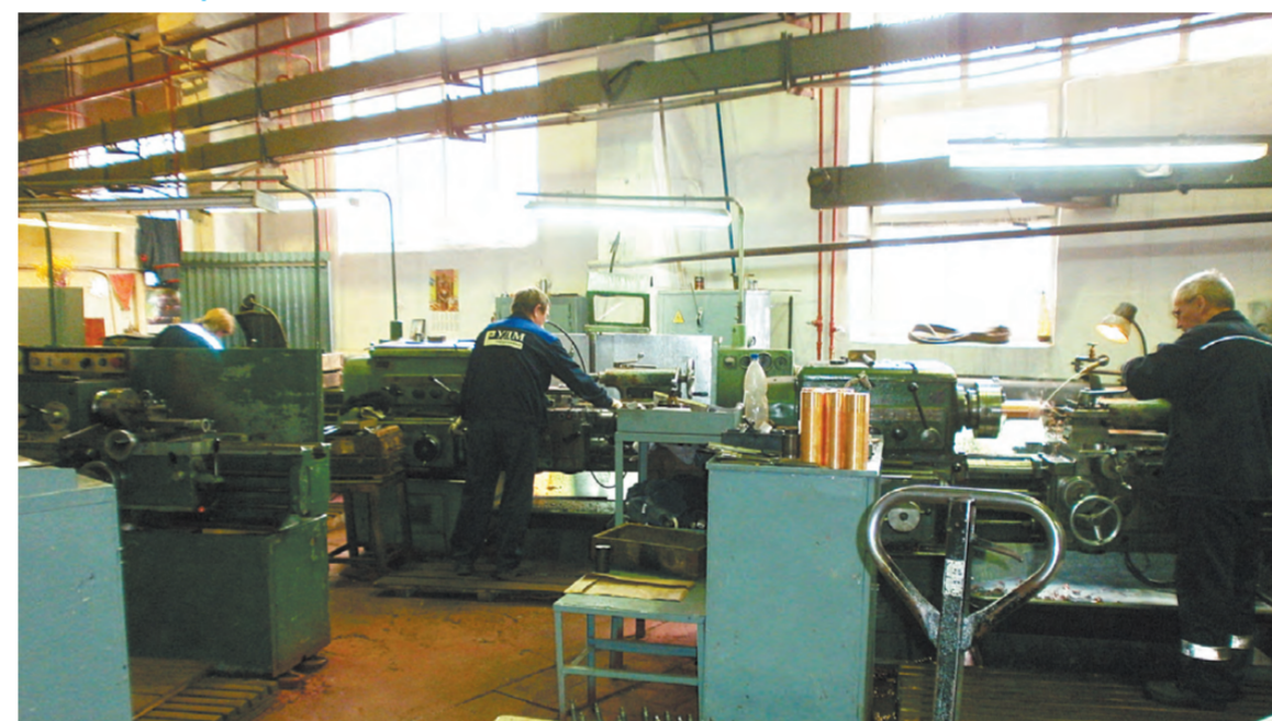
На токарном участке трудятся токари-универсалы.