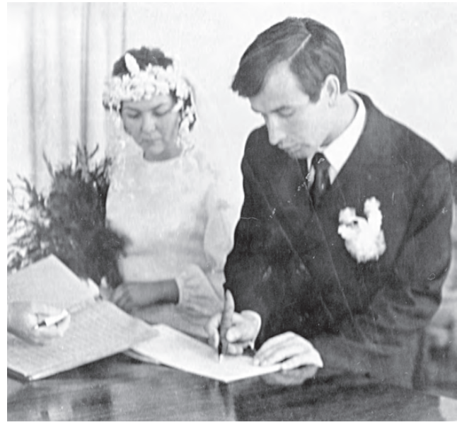
Свадьбу сыграли в 1975.