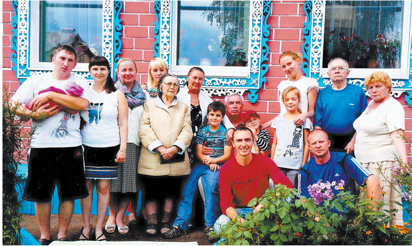
В кругу большой семьи.