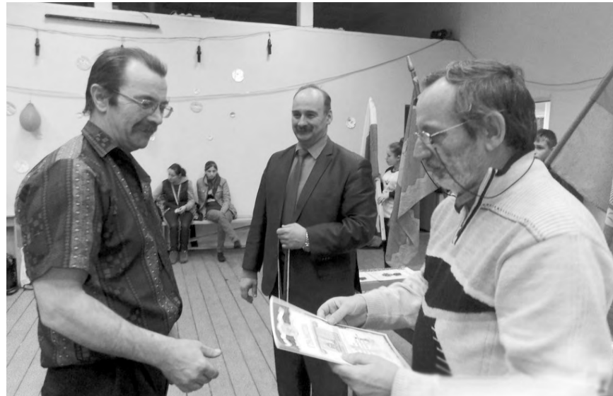
На снимке - церемония награждения.