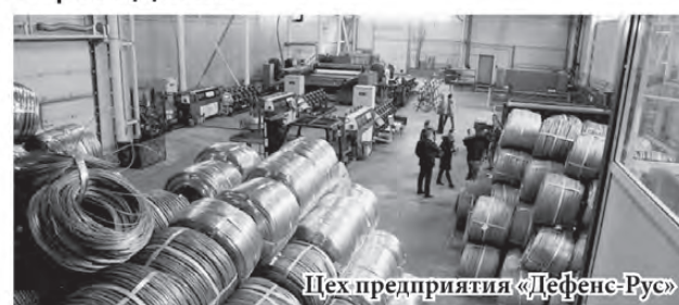
Цех предприятия «Дефенс-Рус»