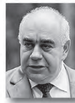
Аркадий Белявский, министр здравоохранения Свердловской области:

«Понимание, что необходимо выделять дополнительные средства на оказание нашим жителям высокотехнологичной медицинской помощи, есть. Прошу министерство здравоохранения готовить соглашение с министерством здравоохранения России на получение федеральной субсидии в полном объеме. Лимиты областного бюджета будут открыты».