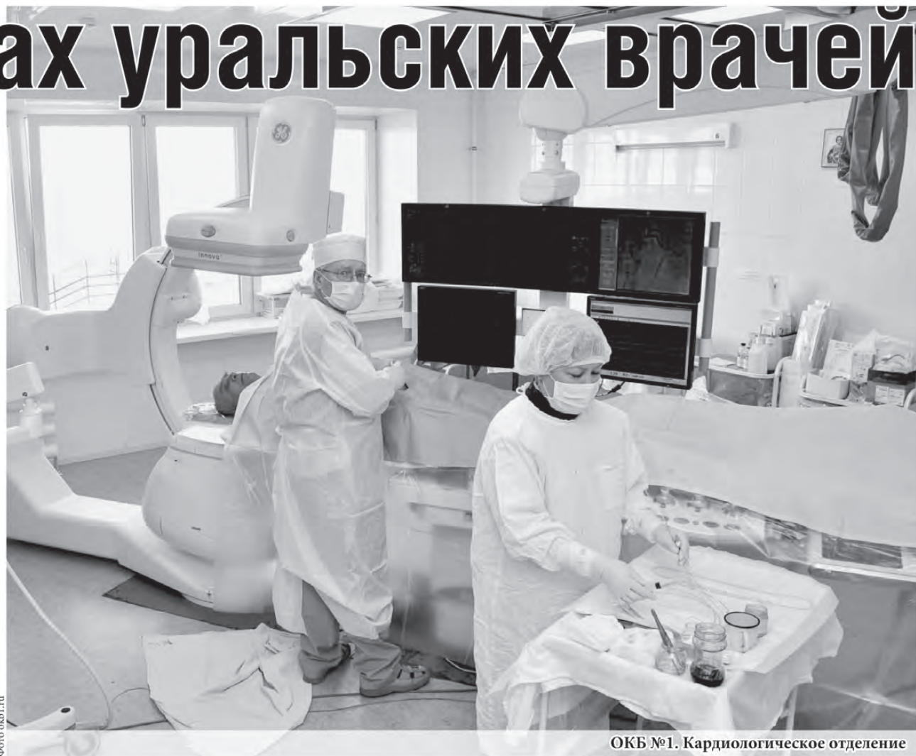
ОКБ №1. Кардиологическое отделение

Мы, члены Совета Медицинской Палаты Свердловской области, не можем оставаться безучастными к тому, что отдельные люди в угоду собственным амбициям и экономическим интересам пытаются использовать недопустимые методы для того, чтобы создать вокруг медиков и их работы исключительно негативную информационную обстановку...».