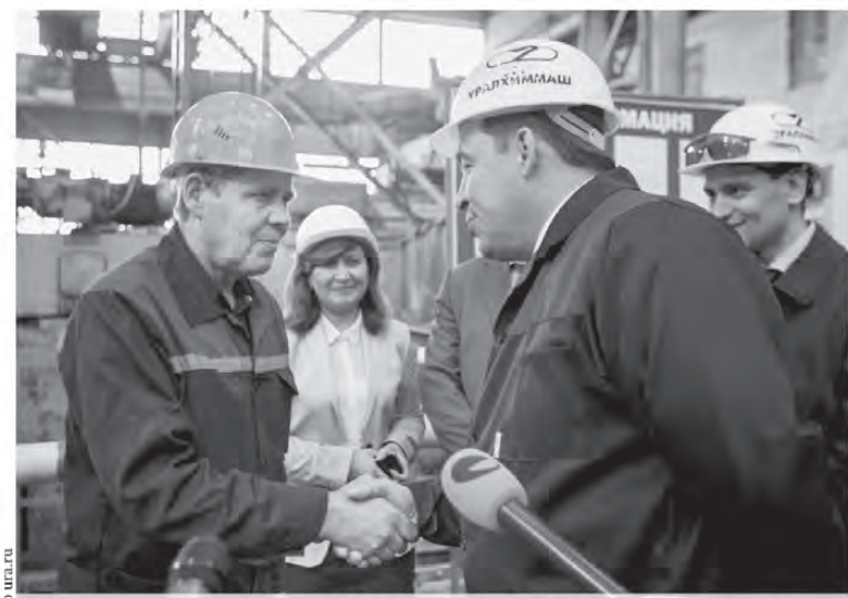
Евгений Куйвашев с работниками Уралхимваша

С начала 2016 года индекс промышленного производства в Свердловской области вырос на 23,6 процента. Эти свежие статистические данные вновь подтверждают верность тезиса губернатора Евгения Куйвашева о том, что обрабатывающие производства являются локомотивом промышленности региона и основой роста экономики.