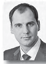
Денис Паслер, председатель правительства Свердловской области:

на софинансирование областных обязательств по оказанию жителям региона высокотехнологичной помощи. Это вторая по объему сумма после Москвы.