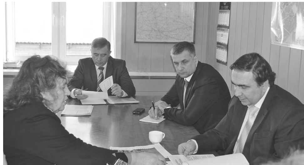
Министр Н. Смирнов (справа) совместно с В. Шлегелем и А. Качуриным ведёт приём.

10 марта в рамках проведения Дня министерства Реж посетил министр энергетики и жилищно-коммунального хозяйства Свердловской области Николай Борисович Смирнов.