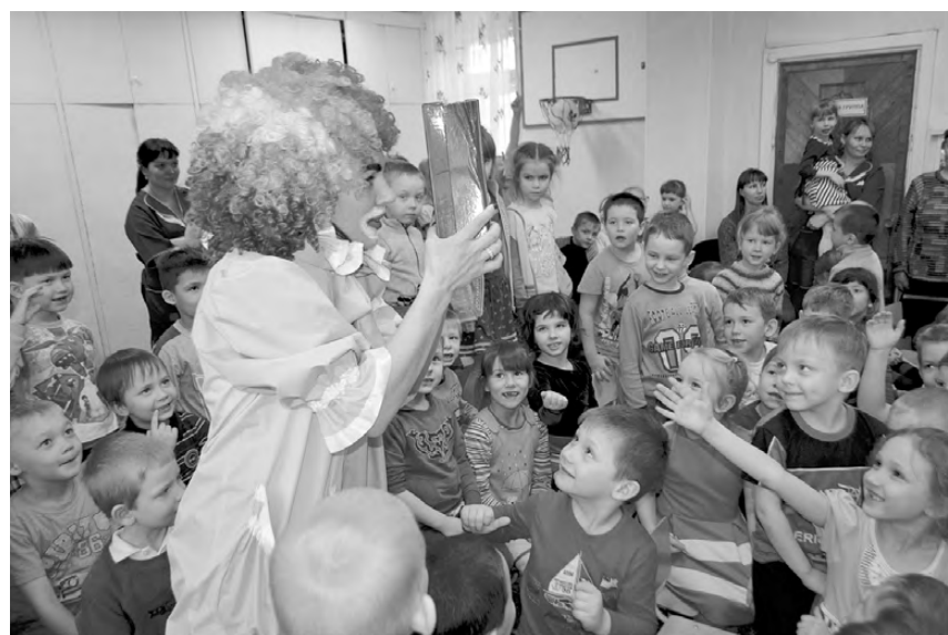
Дети с удовольствием включились в игру.