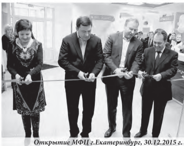
Открытие МФЦ г.Екатеринбург, 30.12.2015 г.