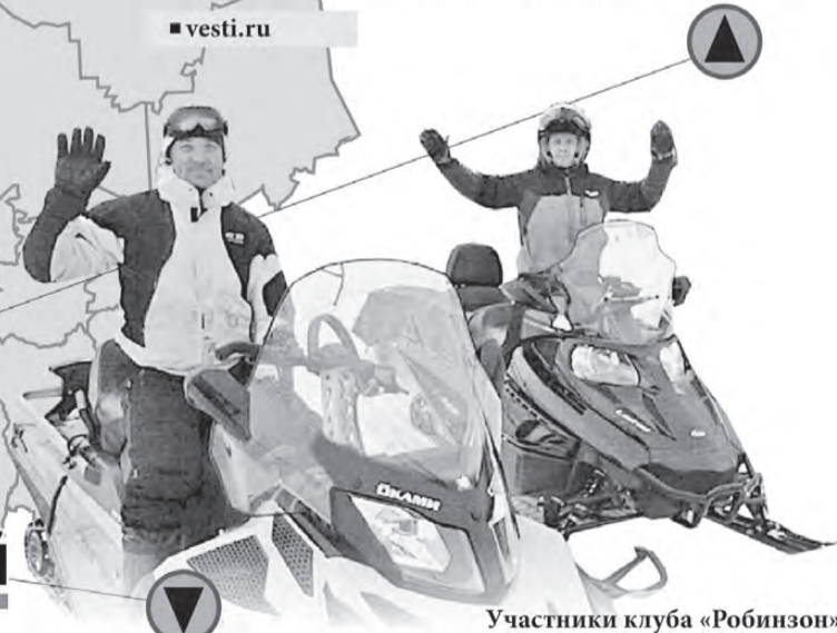
Участники клуба «Робинзон»