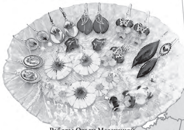
Работы Ольги Мезениной