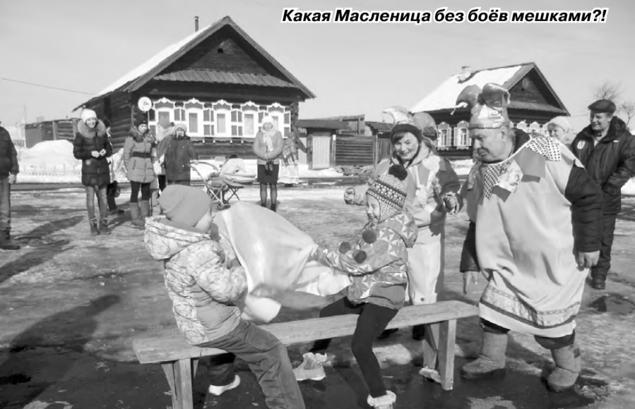
Какая Масленица без боёв мешками?!

С. КРИВКО, фото автора и О. ПЕРЕГУДОВОЙ.