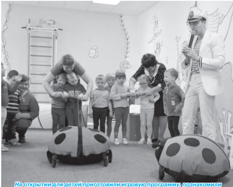
На открытии для детей подготовили игровую программу, познакомили с сапсаном Йогуртом и дали «попробовать» оборудование.