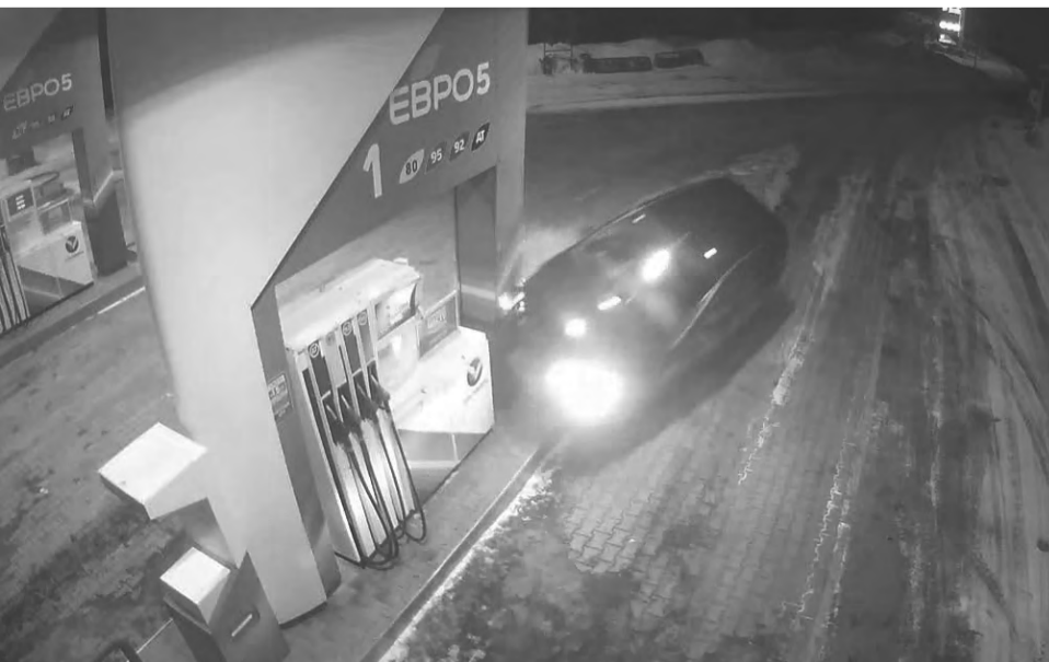
Момент столкновения: легковушка против бензоколонки.