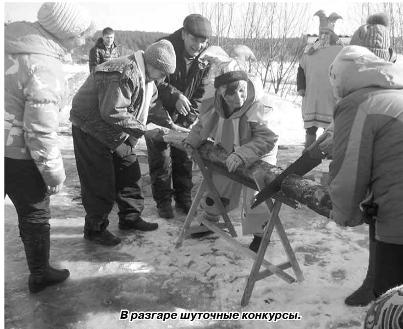
В разгаре шуточные конкурсы.