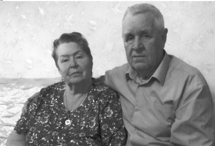
Вся жизнь – плечом к плечу.