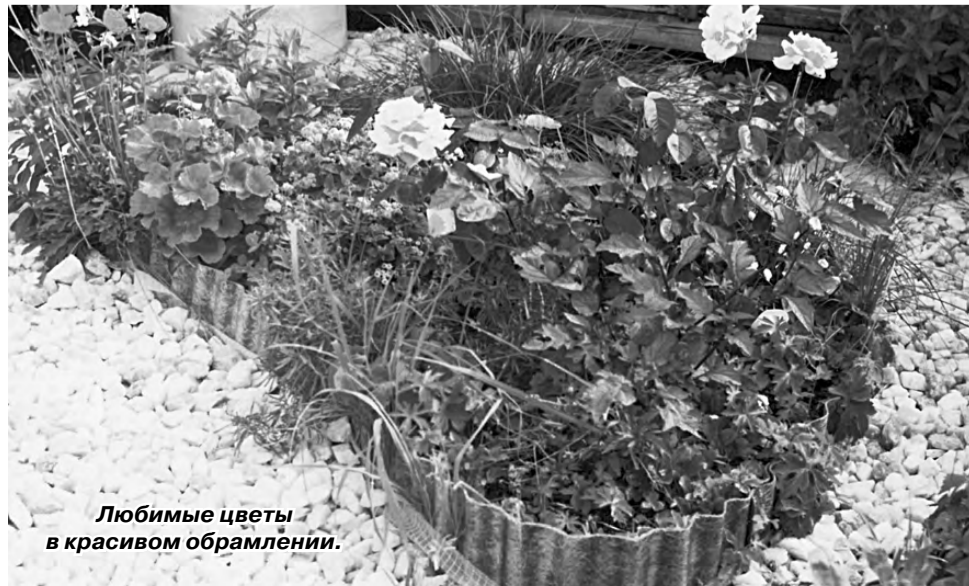
Любимые цветы в красивом обрамлении.