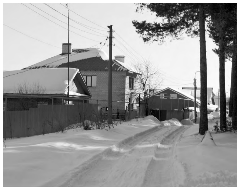
А на некоторых улицах и в среду к домам ведёт лишь наезженная колея.