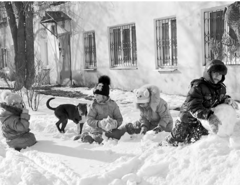
Детвора от души радовалась снегу!

В минувшие выходные Реж, как и всю Свердловскую область, просто завалило снегом. Автомобилистам пришлось непросто. Если центральные дороги расчистили довольно оперативно, то в большинстве дворов к очистке даже не думали приступать, машины буксовали и вязли в снегу, и попытки откопать любимое авто лопатой далеко не всегда были успешны. Не в лучшей ситуации оказались и пешеходы, вынужденные протоптывать тропы даже на главных улицах города.