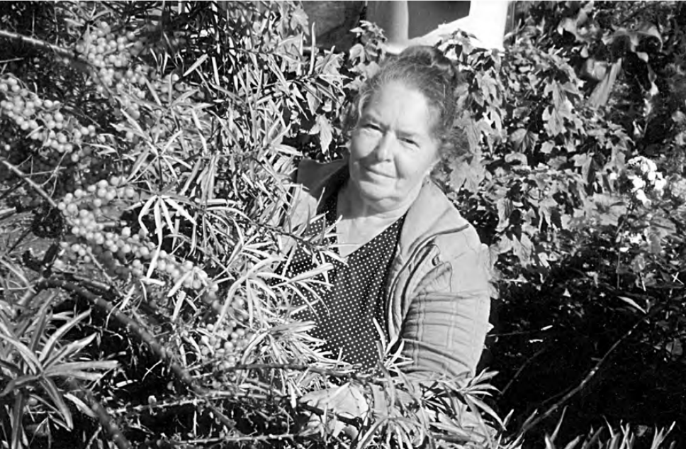
Поспела в саду облепиха.