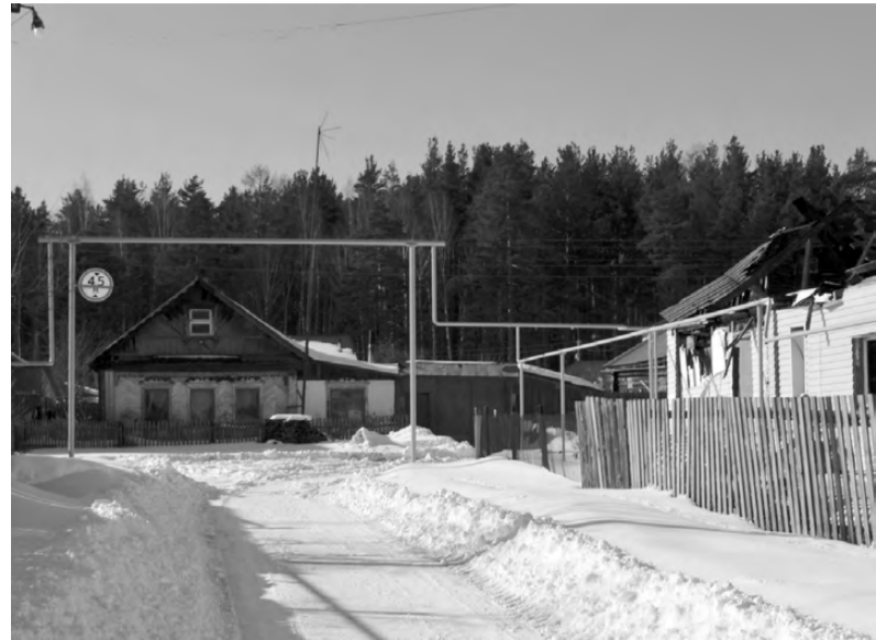
Как рассказали жители частного сектора Быстринского, расчистки улиц им пришлось ждать несколько дней. Потом технику всё-таки прислали, но очищены узкие участки – не разъехаться.