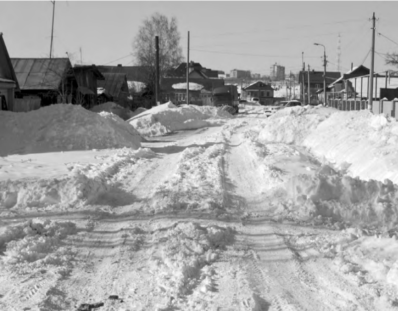
Ул. Чайковского (м-н Гавань) осталась неочищенной даже после выходных.