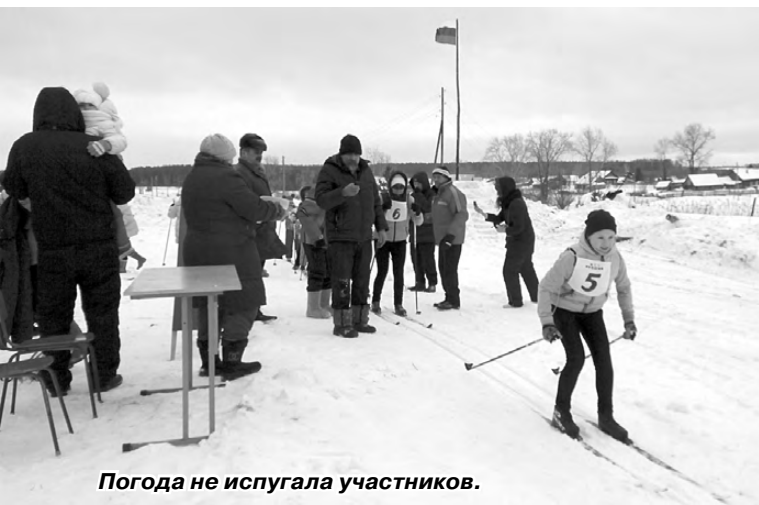
Погода не испугала участников.