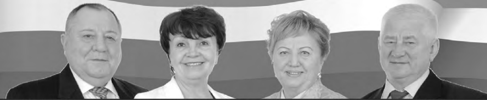
КОНОВНИЦЫН Юрий Иванович