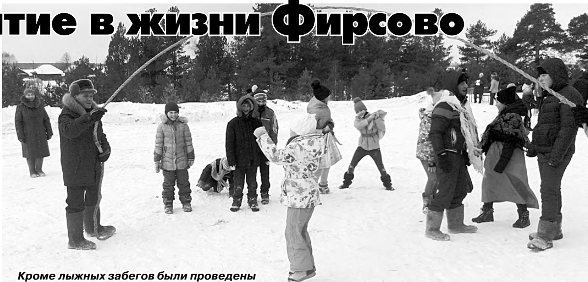
Кроме лыжных забегов были проведены различные игры для детей.

Второй год в Фирсово проводится лыжная гонка, посвящённая Дню защитника Отечества.