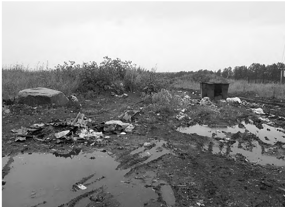
Жители Кочнево возмущены: недавно кто-то привёз строительный мусор, есть опасение, что поле снова завалит крупногабаритным хламом.

Как отучить людей мусорить? Государство предлагает наказывать штрафом. Согласно статье 15-1 областного закона №52 ОЗ «Выбрасывание бытового мусора и иных предметов в не отведённых для этого местах», нарушитель может заплатить за своё злодеяние штраф в размере от 1 тысячи до 5 тысяч рублей, если это физическое лицо. На должностных лиц налагается штраф от 10000 до 30000