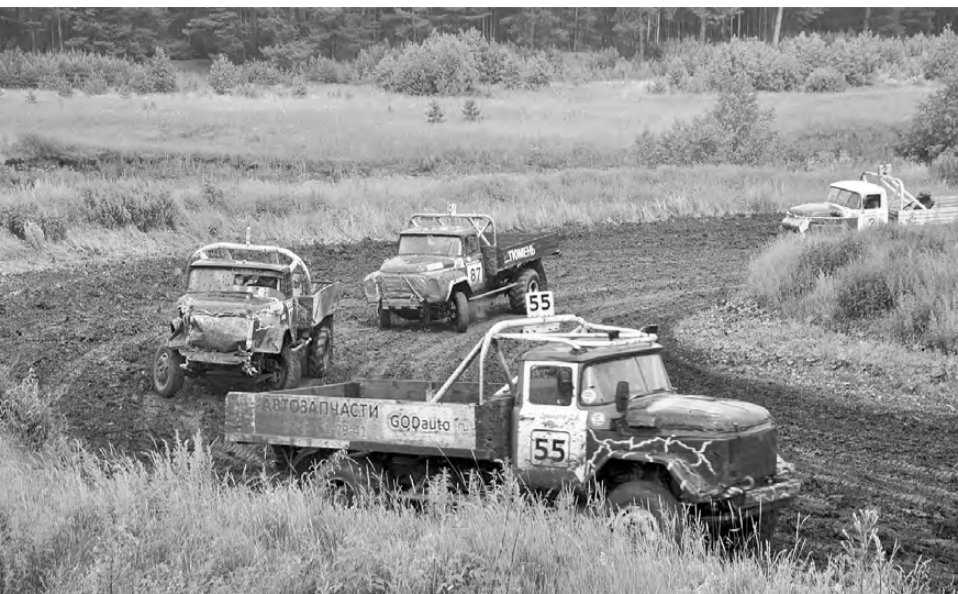
Борьба на повороте.