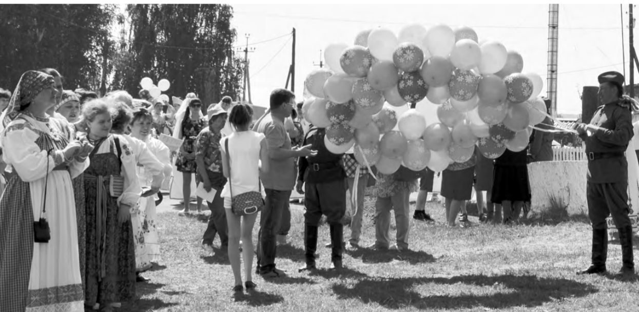
Венок дружбы запускают в небо.

Вот уже в 13-й раз в селе Ницинском Ирбитского района прошёл традиционный областной фестиваль национальных культур «Венок дружбы».