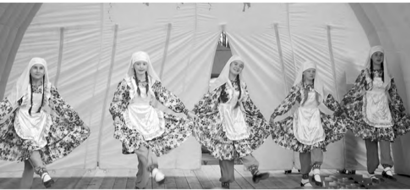
Танцевальный коллектив «Веснушки».

Священный для мусульман месяц – Рамадан – завершается праздником Ураза-байрам. Также его называют праздником разговения. Строгий пост сменяется пышным праздником, который длится на протяжении трёх дней. Разрешено вкушать различные блюда и напитки.