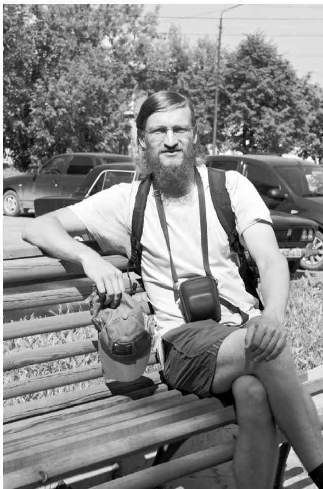
Перед посещением исторического музея.