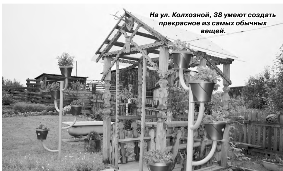
На ул. Колхозной, 38 умеют создать прекрасное из самых обычных вещей.