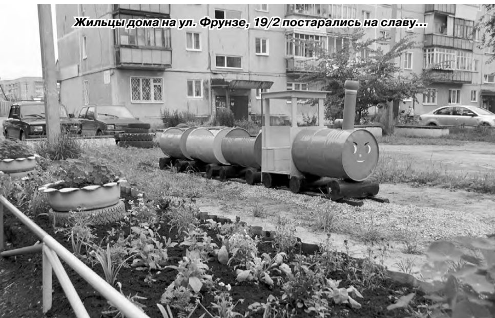
Жильцы дома на ул. Фрунзе, 19/2 постарались на славу...