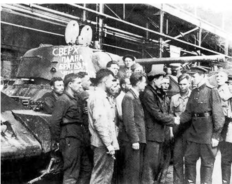
Сверхплановый танк братьям-уральцам.