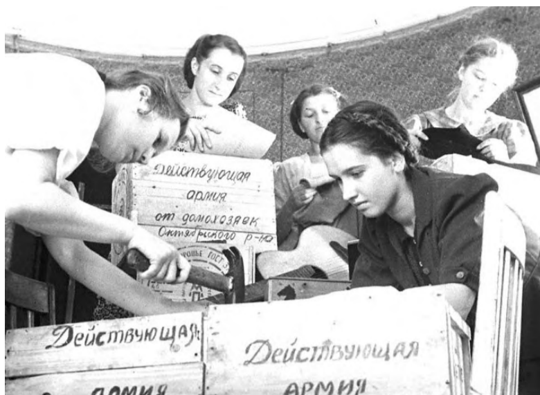
Только за полгода на фронт прибыло 3400 вагонов с посылками для бойцов.

Сущностью немецко-фашистского оккупационного режима было стремление уничтожить в нашей стране государственную идеологию и само государство, превратить страну в аграр-