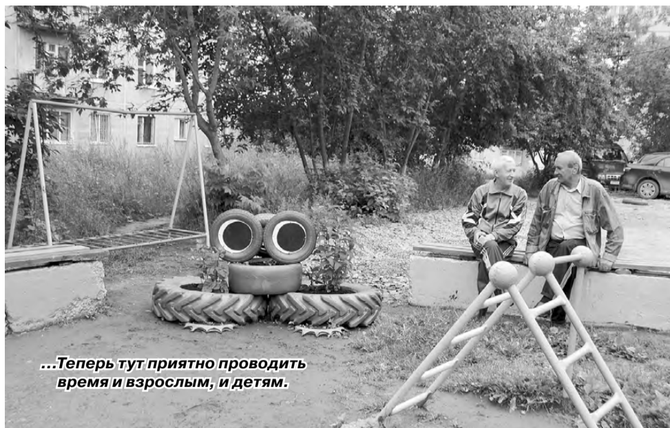
...Теперь тут приятно проводить время и взрослым, и детям.