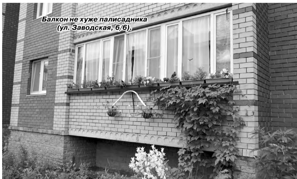
Балкон не хуже палисадника (ул. Заводская, 6/6).

Насколько красивым будет мир вокруг нас, зависит не только от властей, коммунальных служб и финансовых возможностей. Сами жители часто способны создать из обычных вещей и в обычных неухоженных дворах мир мечты, радуя себя, своих детей и прохожих, любующихся творениями чьих-то заботливых рук. А если жильцы действуют сообща с управляющими компаниями, дело спорится ещё лучше.