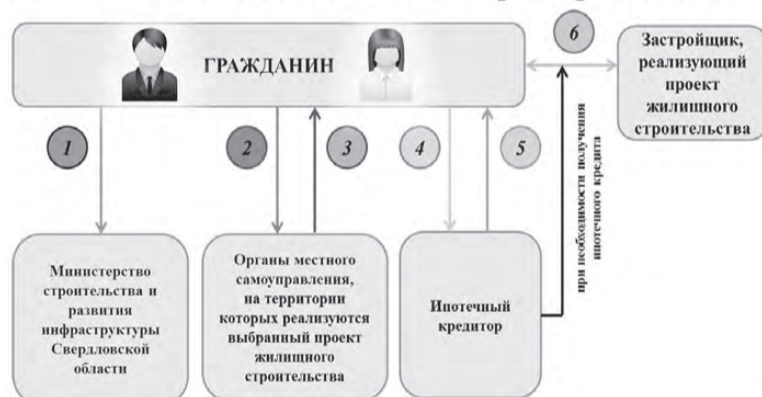
Схема участия уральцев в новой жилищной программе

на в список участников Программы при необходимости обратиться к ипотечным кредиторам с целью подтверждения возможности предоставления ипотечного кредита (займа) в рамках Программы (список ипотечных кредиторов должен быть размещен на сайте Минстроя Свердловской области).