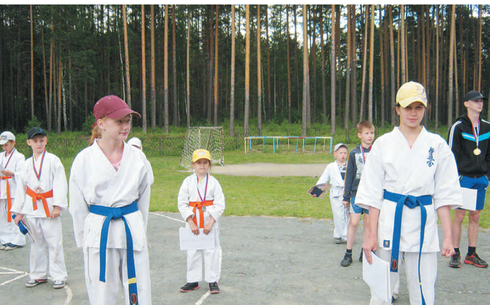
Отдых, тренировки, соревнования – так проводят лето спортсмены.

С 27 мая по 16 июня юные каратисты тренировались, играли, оздоравливались и просто весело проводили время в загородном лагере им. П. Морозова «Салют».