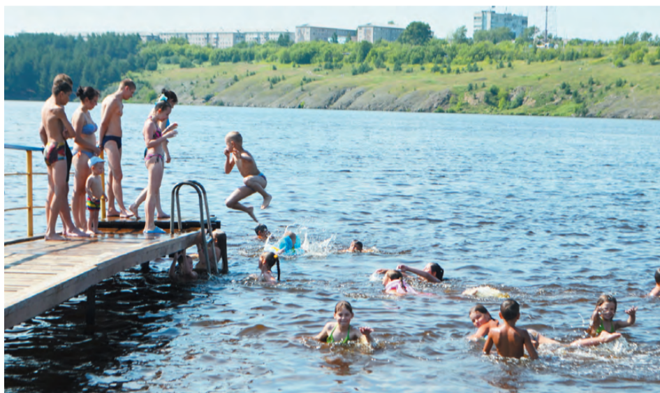
Особенно многолюдно в жаркие дни в зоне отдыха «Нептун».

Специалисты «Центра гигиены и эпидемиологии» одобрили качество воды в Режевском пруду