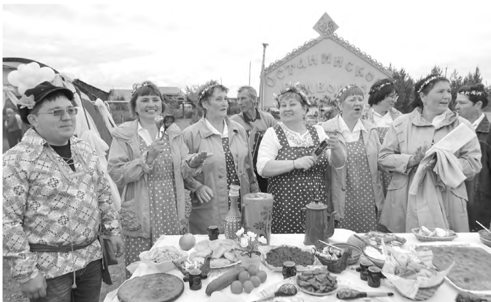
Задорными частушками поднимают настроение останинцы.