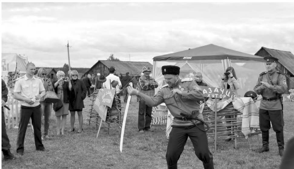
На казачьем хуторе.