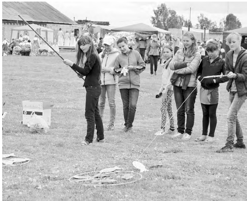
Рыбалка хоть и шуточная, а азарт настоящий!