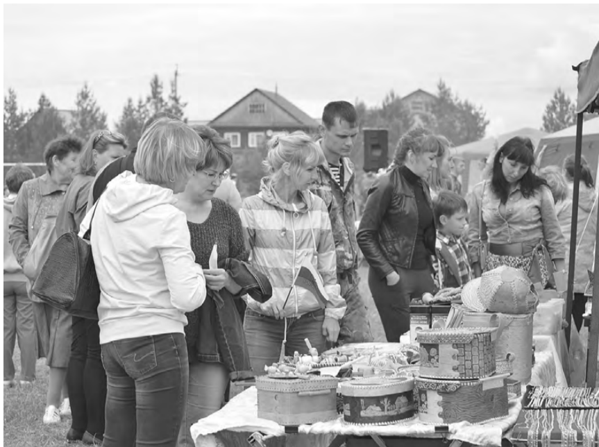
Предметы народного промысла заинтересовали гостей.

P.S. Больше фото смотрите на нашем сайте rezh-vest.ru .