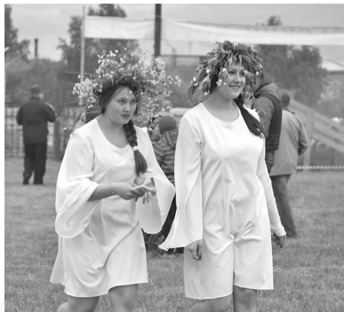
Праздничное настроение было у всех участников мероприятия.