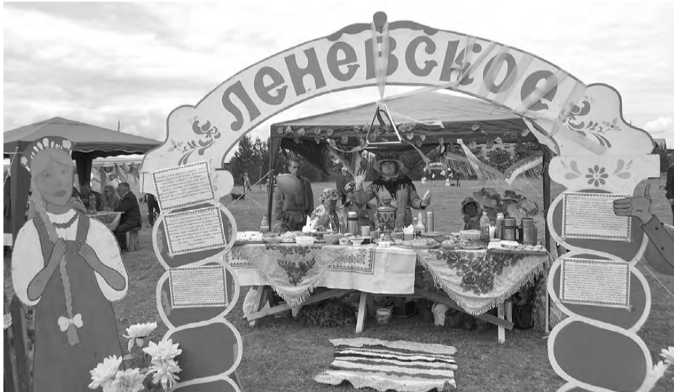
Ленёвцы приветствуют гостей.