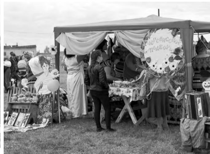
Все старались удивить жюри оформлением подворья.