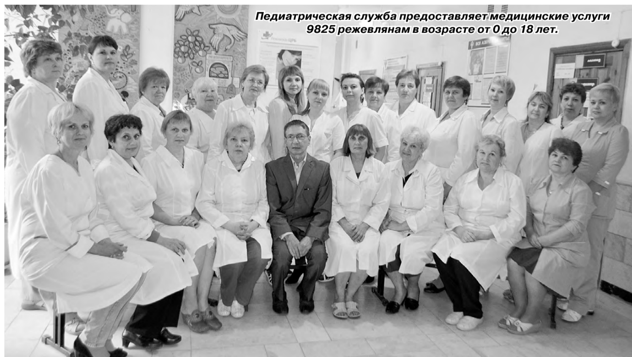
Педиатрическая служба предоставляет медицинские услуги 9825 режевлянам в возрасте от 0 до 18 лет.