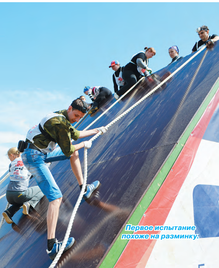
Первое испытание похоже на разминку.