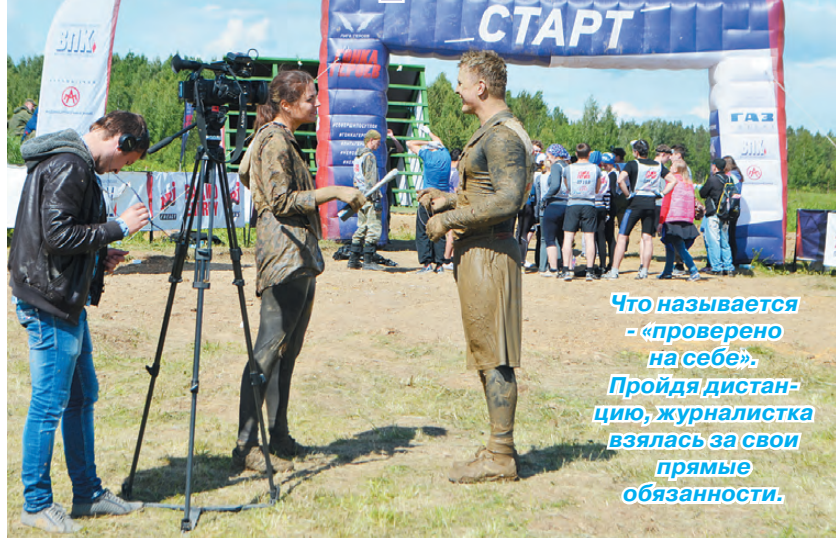
Что называется - «проверено на себе». Пройдя дистанцию, журналистка взялась за свои прямые обязанности.

Стать участником захватывающего приключения среди однообразных будней, проверить свою физическую и моральную подготовку и выжать из себя максимум смогли участники «Гонки героев», впервые прошедшей в Екатеринбурге на полигоне «Свердловский» 13 июня. Среди смельчаков, участвовавших в этой проверке на прочность, были и режовляне.