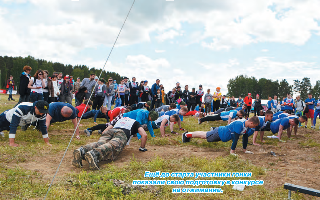
Ещё до старта участники гонки показали свою подготовку в конкурсе на отжимание.