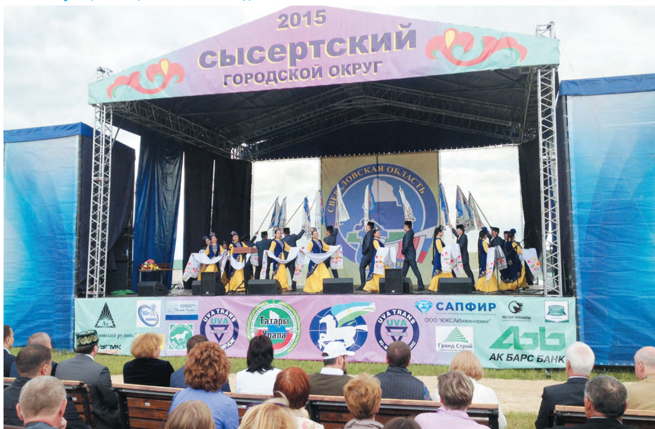
На сцене - Государственный ансамбль песни и танца Республики Татарстан.