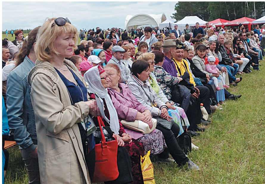
Зрителей завораживало выступление артистов.