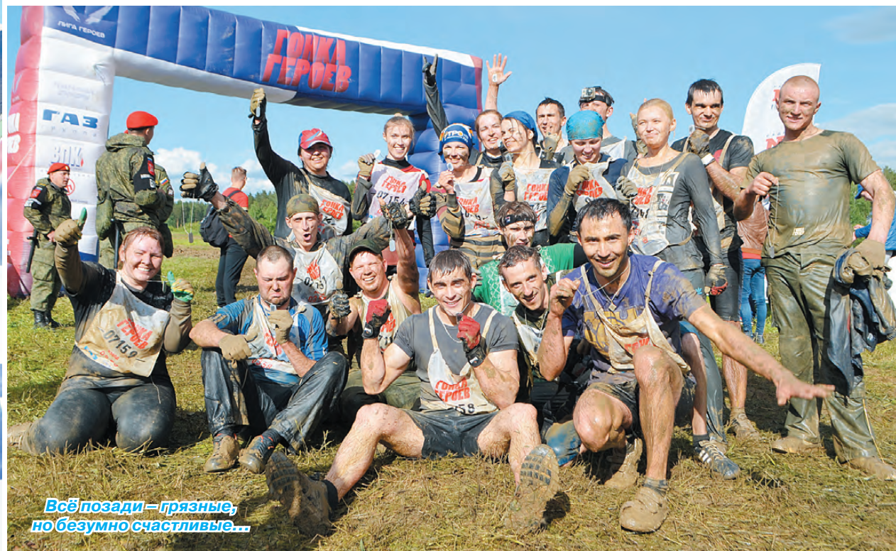
Всё позади - грязные, но безумно счастливые...