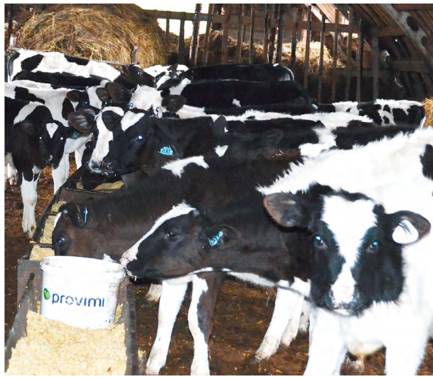
Многие начинающие фермеры используют полученную поддержку на разведение крупного рогатого скота.

Напомним, что в 2012 и 2013 годах режевские фермеры также отлично защищали свои бизнес-проекты и получали по 3 гранта.