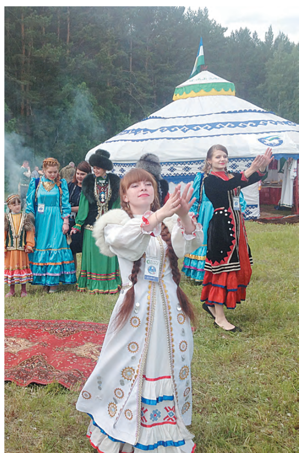
Песни, танцы и веселье царили на празднике.