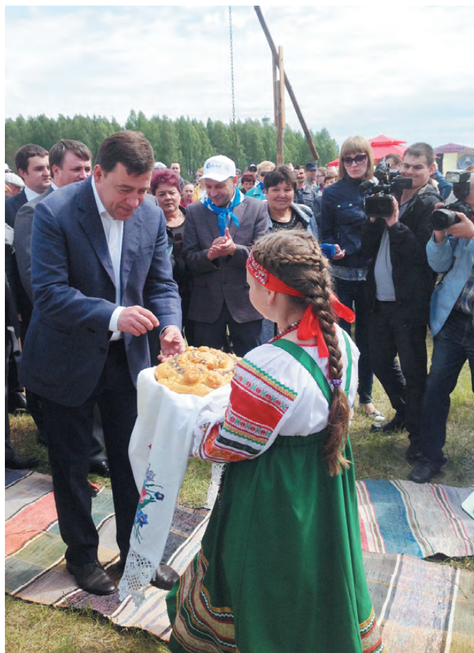
Губернатора Евгения Куйвашева на подворьях угощали национальными блюдами.