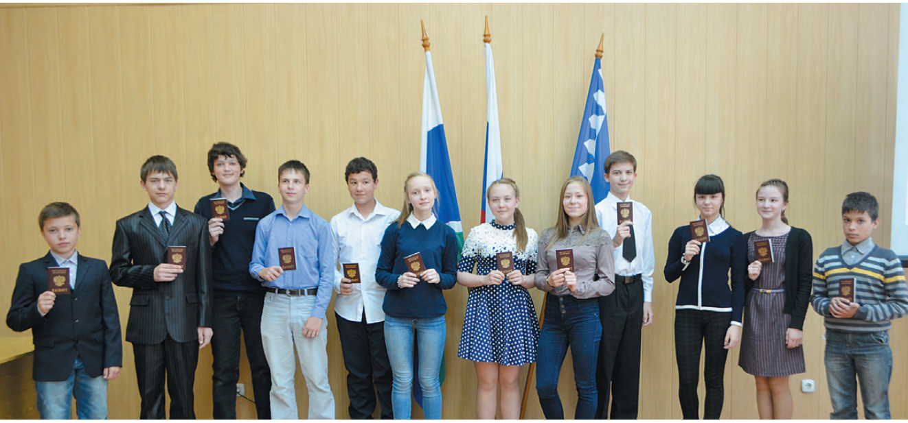
Юные граждане России.