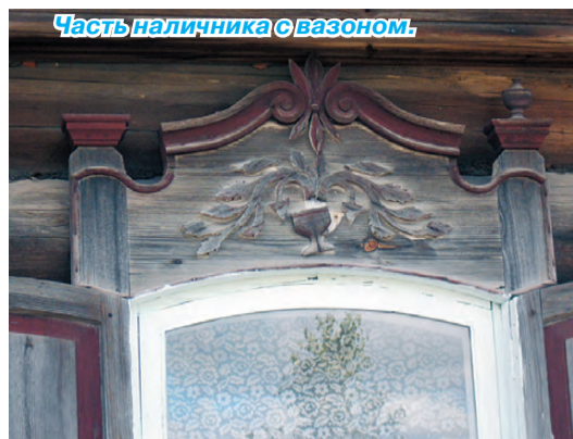
Часть наличника с вазоном.

С 1860-х годов распространяются наличники с солярной (солнечной) символикой. Увеличивается верхняя (лобовая) доска, часто появляются два ставня. Используется сложная глухая резьба, которая наполнена смыслом: солнце, земля и вода, без которых нет продолжения жизни. В центре лобовой доски изображалось большое солнце, а по углам - маленькие,