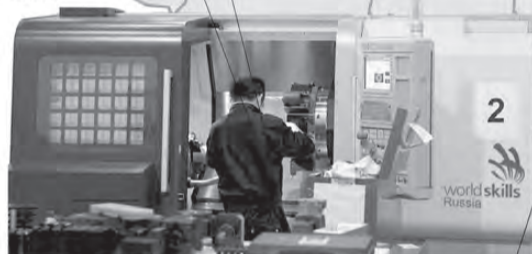
● Нижний Тагил