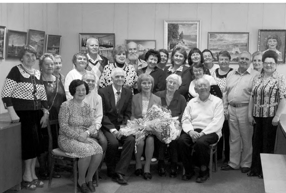
На открытие выставки собрались друзья художницы.