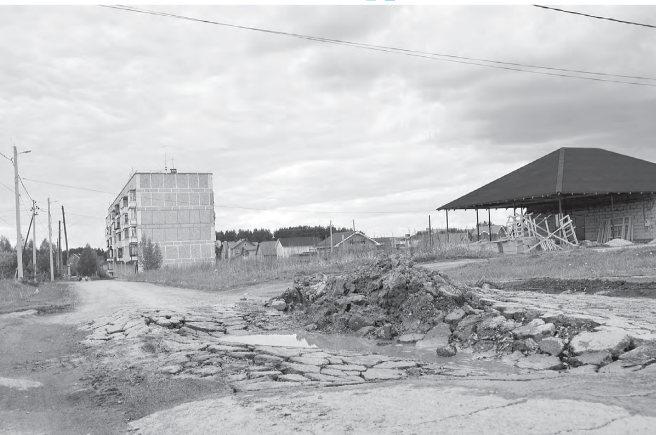
Вот так дорога!

Дорога к крайнему многоэтажному дому на 7 Ветрах на ул. М. Горького выглядит, как после взрыва. Уже несколько недель водители вынуждены искать пути объезда. И если в сухую погоду это не так проблематично, то в дожди всё гораздо хуже.