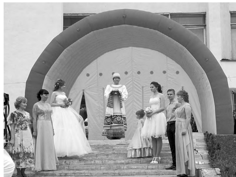
Ателье города показали свои лучшие наряды.