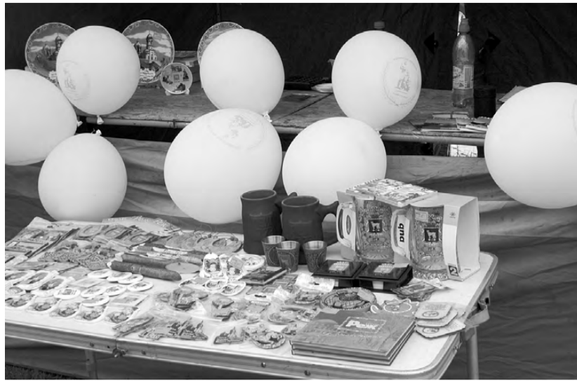
Полиграфический комплекс «Лазурь» помимо печати журналов и газет занимается выпуском сувенирной продукции с символикой Режа. За дизайн этой продукции в конкурсе «Принтмастер» предприятию присуждён главный приз – «Золотой печатный знак».

Положение о порядке предоставления субсидий утверждено постановлением администрации РГО №939 от 27.05.2015 «Об утверждении Порядка предоставления субсидий на приобретение сельскохозяйственной техники и оборудования» и размещено на официальном сайте Режевского городского округа http://rezhevskoy.midural.ru в разделе «Малое и среднее предпринимательство».