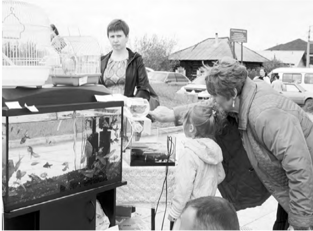
Одним из самых привлекательных на ярмарке для детей и взрослых была торговая точка магазина «Ундина». Рыбки, черепашки, попугаи – кому не хочется посмотреть на них!