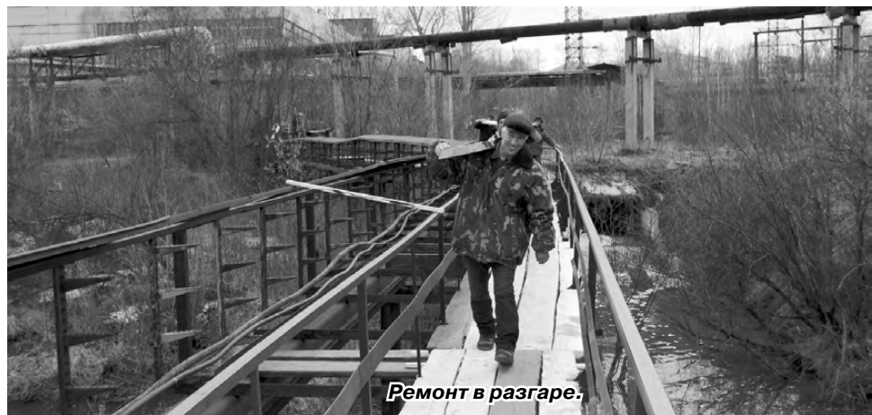
Ремонт в разгаре.