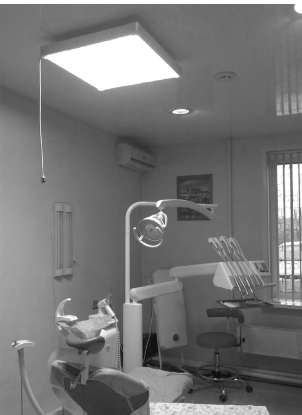
Ещё одно направление компании - светодиодное освещение.