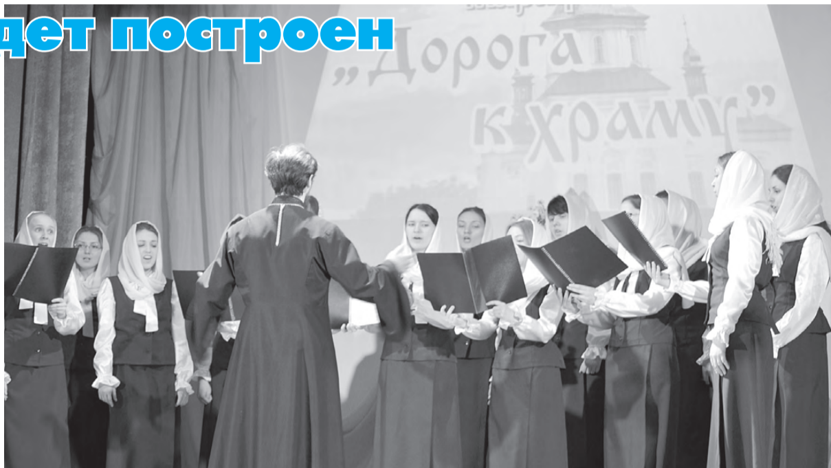
Выступает хор Екатеринбургской православной духовной семинарии.