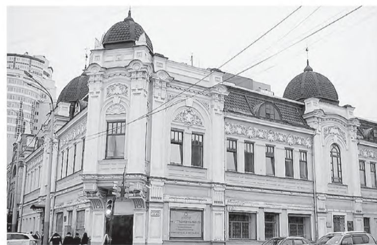
В Екатеринбурге это здание построено купцом Первухиным в начале XX века. В годы Великой Отечественной войны здесь работал прославленный радиодиктор Юрий Левитан. На здании установлена мемориальная доска.

залом и плавательным бассейном. На строительство ФОКа из регионального бюджета в 2014 году было выделено 50 миллионов рублей, в 2015 году – 67,4 миллиона рублей. В настоящее время решается вопрос о привлечении средств из федерального бюджета.