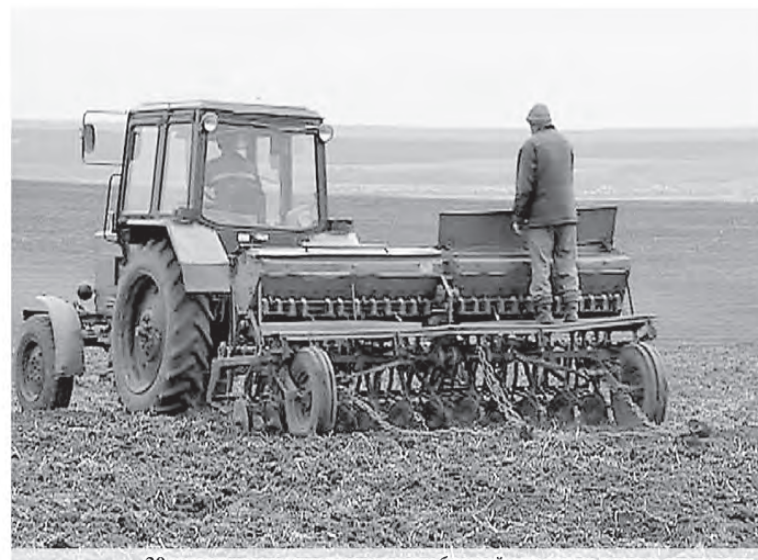
20 тысяч тонн минеральных удобрений внесут на поля в этом году

По последним данным министерства сельского хозяйства РФ, в южных районах страны посевная началась на 2 недели раньше. Мы не исключаем, что благодаря хорошей погоде и мы сможем выйти в поля раньше. А пока в рабочем порядке готовимся к кампании».