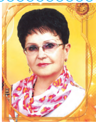
Мы ценим Вас, конечно, без сомнения, И признаём Ваш труд мы непростым. Родители и ученики 5 «а» класса школы №3.

Мы поздравляем с юбилеем И пожелаем счастья в этот час, И пусть придут к Вам радость и веселье, Ведь лучше педагога нет у нас. Пусть глаза от радости искрятся, Пусть улыбка не покинет губ, Пусть будет ежегодно расширяться Талантливых детишек целый круг. Мы Вам желаем капельку терпения К настойчивым, активным и смешным.