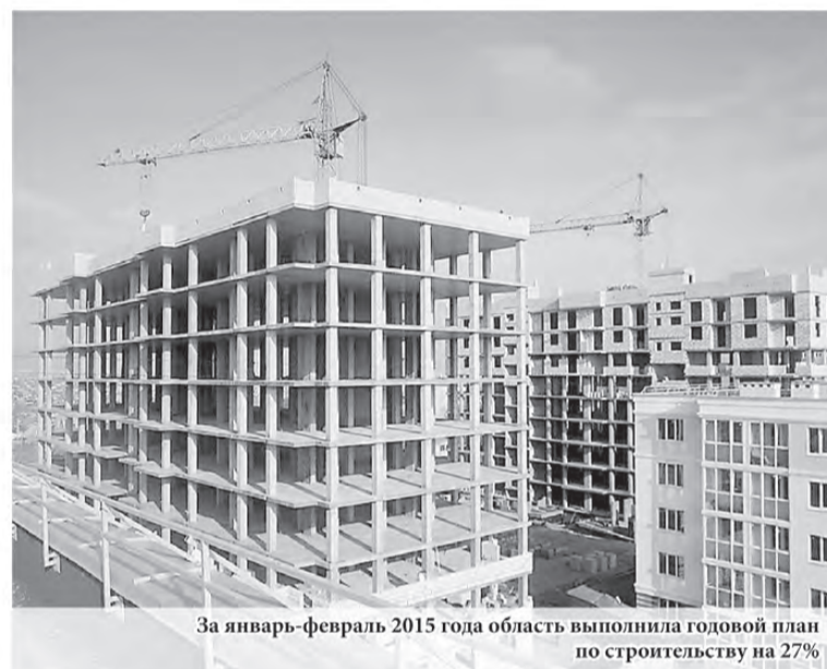
За январь-февраль 2015 года область выполнила годовой план по строительству на 27%

годового плана. Всего к концу года мы планируем построить 2,1 миллиона квадратных метров жилья. Но важно понимать, что сейчас сдаётся то, что начало возводиться в 2013 году – начале 2014 года. Поэтому сегодня мы должны делать задел на будущие периоды. Важно, чтобы застройщики не только работали над завершением имеющихся объектов, но и начинали новые проекты, которые будут сдаваться в 2016-2017 годах».