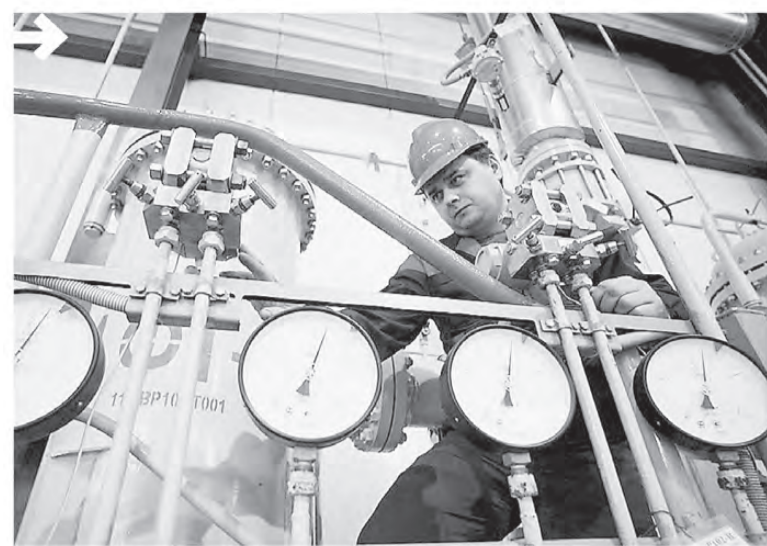
В сфере ЖКХ Свердловской области сейчас реализуются 75 инвестпроектов