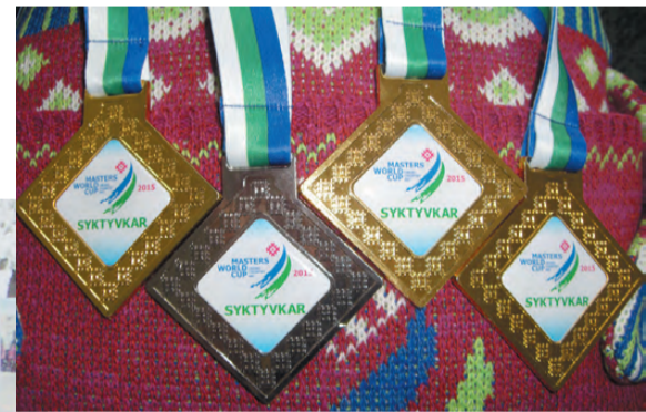
Четыре медали, которыми может гордиться весь наш город.

Наши ветераны показывают младшему поколению отличный пример того, как с любовью к спорту можно добиться очень многого. Как отмечает губернатор Свердловской области Евгений Куйвашев, сейчас физкультурой и спортом занимаются уже около 27% жителей региона, и год от года эта цифра растёт. К 2020 году планируется довести уровень обеспеченности населения спортивными сооружениями до 48% (сейчас этот показатель составляет 27,4%).