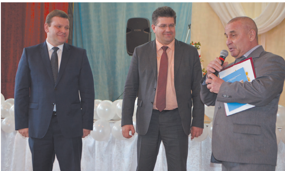
Высокие гости – министр экономики Д. Ноженко и министр социальной политики Свердловской области А. Злоказов - на юбилее ООО «РП «Элтиз».