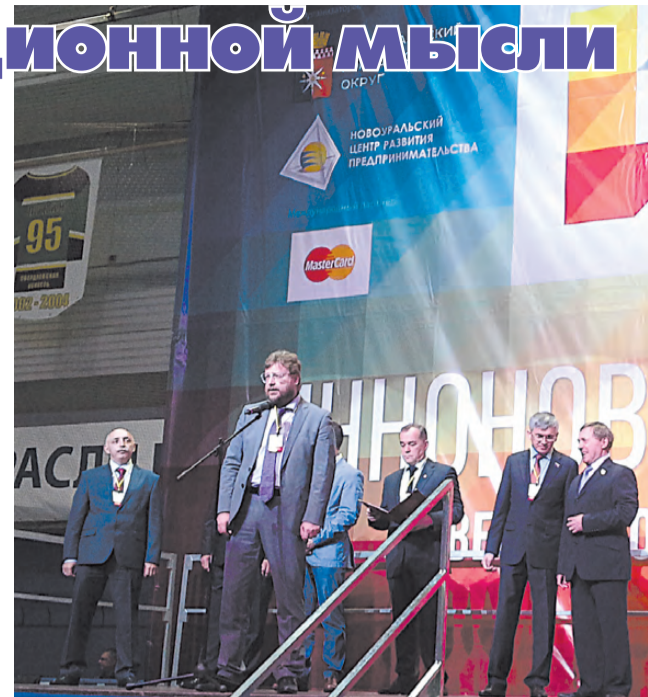
Участников выставки поздравляет Вадим Дубичев.

Продукция Новоуральского молочного завода очень разнообразна: мороженое, йогурты, кисломолочные напитки, творожные сырки, сметана. В дни проведения выставки на заводе открылась линия по производству итальянских и грузинских мягких сыров (моцарелла, рикотта, сулугуни, адыгейский). На открытии линии побывал председатель Правительства Свердловской области Денис Паслер и министр агропромышленного комплекса и продовольствия Свердловской области Михаил Копытов. Денис Паслер, Владимир Машков (глава города Новоуральска) торжественно перерезали символическую красную ленту, таким образом дав старт импортозамещению на территории Новоуральска. Делегация осмотрела установленное