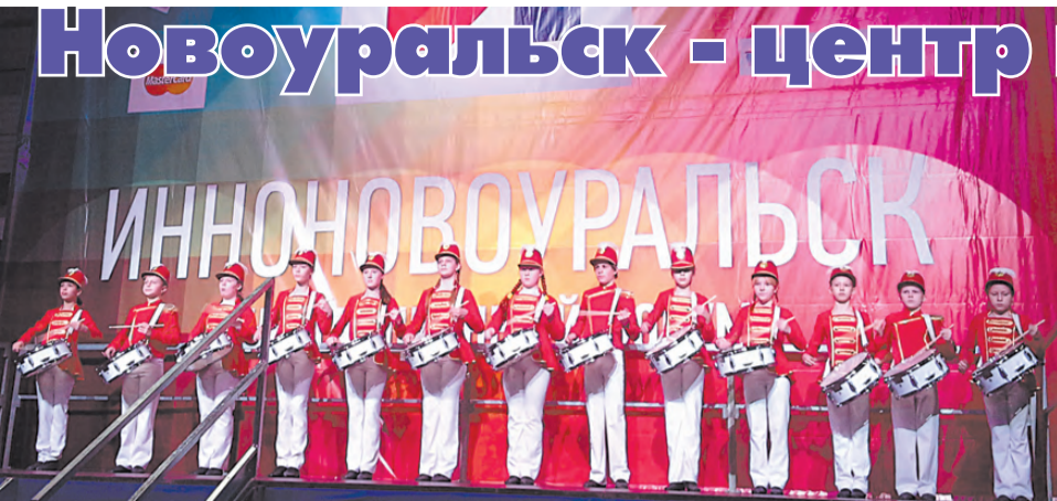
Во время торжественной церемонии открытия выставки.

Выставка достижений предпринимательства «Инно-новоуральск» уже в пятнадцатый раз прошла в городе Новоуральске. Восемнадцатого и девятнадцатого сентября на площадке ледовой арены концертно-спортивного комплекса был представлен ассортимент продукции, производимой на территории Новоуральского городского округа и за его пределами. Участниками выставки стали 44 организации. В рамках выставки открылась ярмарка товаров народного потребления.