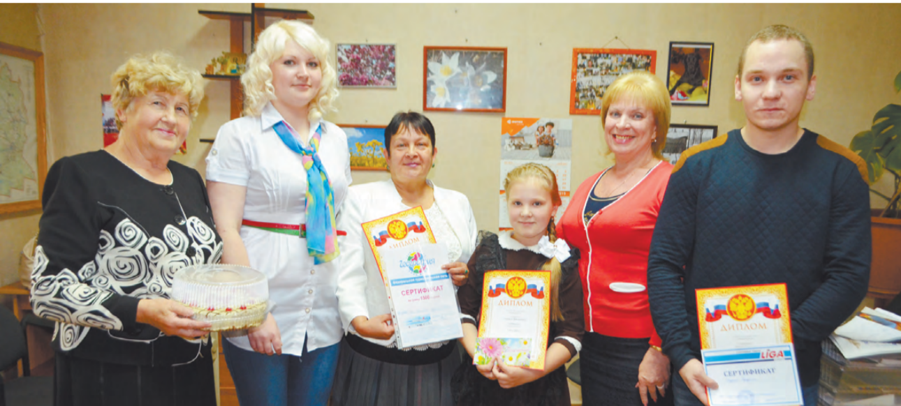
Призёры и спонсоры, пришедшие на награждение.