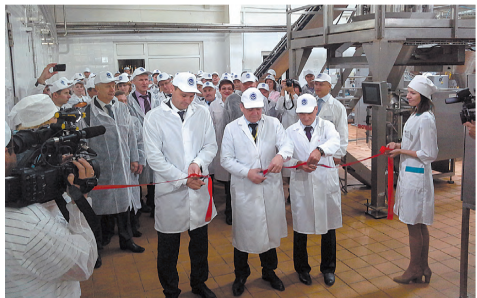
Дан старт импортозамещающему производству.