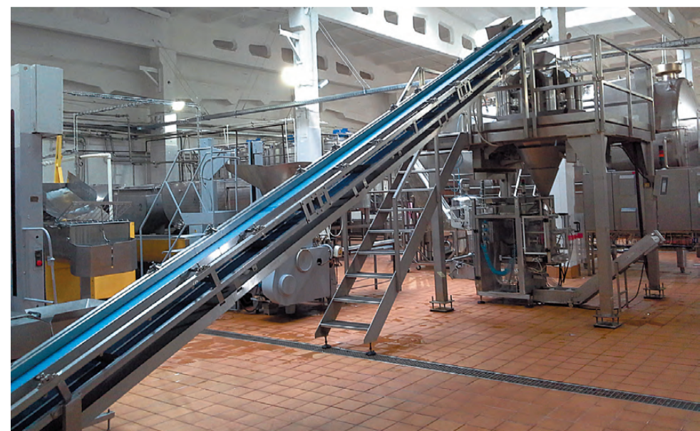
Новая линия Новоуральского молочного завода.