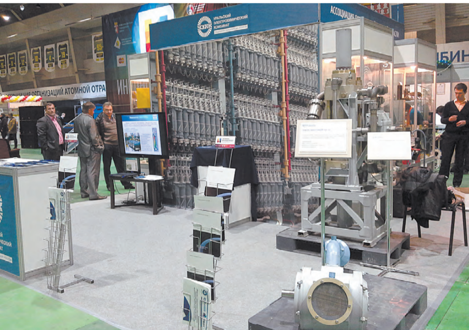
Экспозиция Уральского электрохимического комбината.