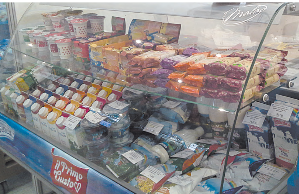
Ассортимент молочного завода разнообразен.