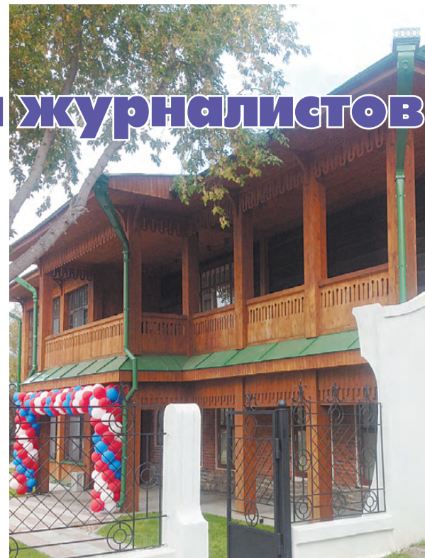
Дом журналистов расположен в старинном уютном особняке.