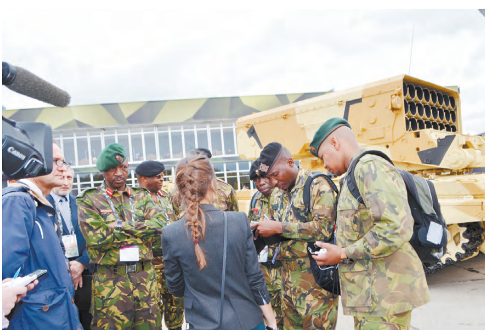
Выставку вооружений посетили 65 иностранных делегаций.