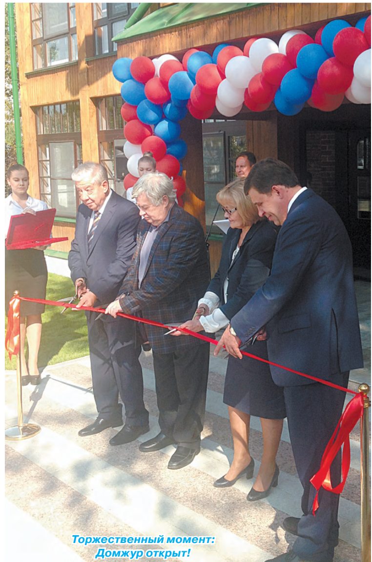
Торжественный момент: Домжур открыт!

Галина ПОПОВА.