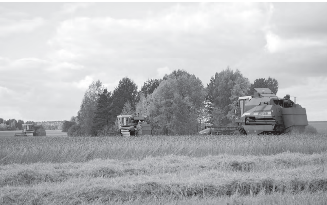
Стройные ряды комбайнов на полях СПК «Глинский».

Дружным строем работают 8 комбайнов на полях СПК «Глинский». К уборке зерновых здесь приступили 20 августа.