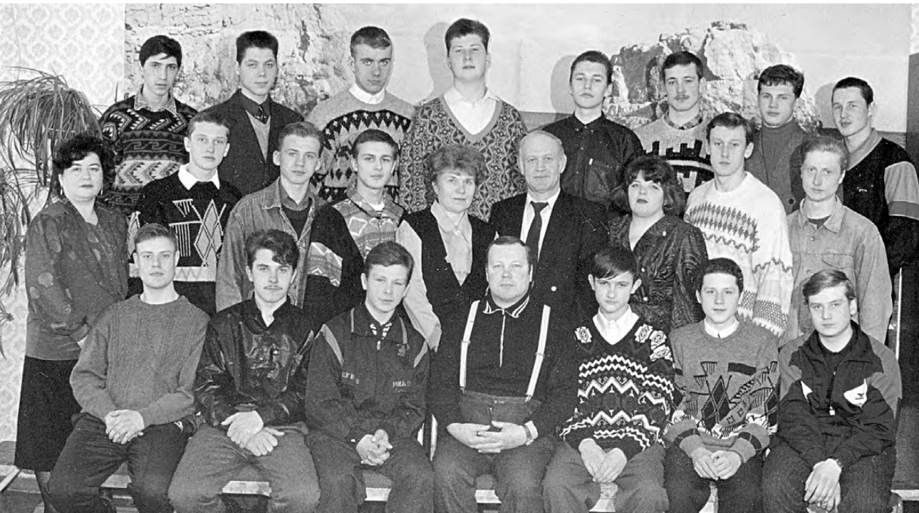
С учениками и коллегами.

Валентина ВОРОБЬЁВА.