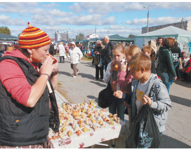
Свистульки мастерицы из Омска не оставляют равнодушными детей.