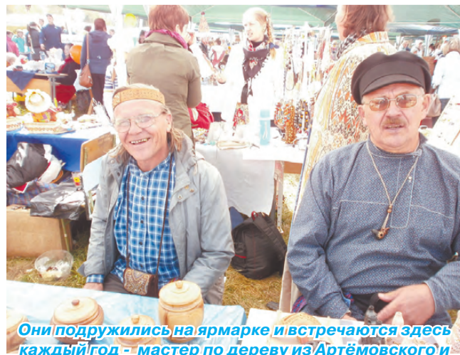
Они подружились на ярмарке и встречаются здесь каждый год - мастер по дереву из Артёмовского и мастер керамики из Сухого Лога. Говорят, подпитываются здесь энергетикой творчества.