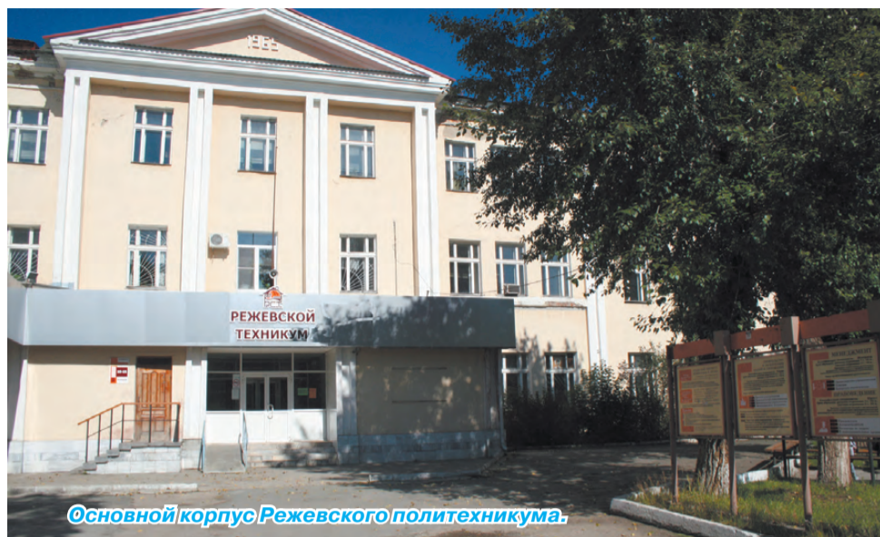
Основной корпус Режевского политехникума.

- Как мы и обещали, никаких радикальных изменений, кроме смены названия, для студентов и преподавателей не произошло. Мы трудимся над созданием единого педагогического и студенческого коллектива. Ведь ещё недавно люди работали и учились в разных организациях, со своими традициями, порядками, укладом. Сегодня штат сотрудников техникума 160 человек, студентов – более тысячи. Однако небольшие изменения всё же будут. В основном они касаются организации учебного процесса. Он будет проходить в трёх зданиях: на Ленина, 4, где будет находиться и административный корпус; на Калинина, 19-б и на Трудовой, 93. Некоторые общеобразовательные предметы будут проходить в