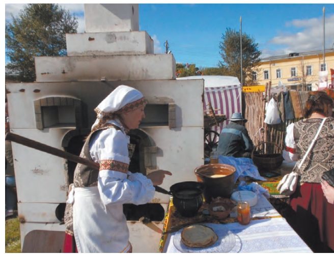
Блины с пылу, с жару из настоящей русской печи.