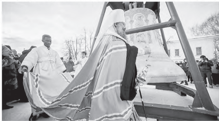
Подготовлено по материалам пресс-службы Законодательного Собрания Свердловской области

Посещение благих мест таких, как Верхотурье, побуждает на добрые дела, повышает самооценку, даёт силы и здоровье, успех в делах. Это так важно! Коллективная поездка в духовную столицу Урала еще раз показала: нужно творить добро, оно воздастся сторицей.