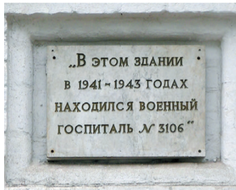
Мемориальная доска госпиталю 3106 на фасаде Режевской школы №1.