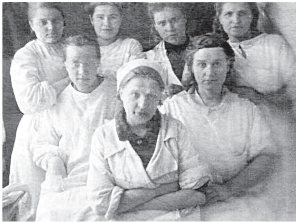
Медицинские сестры госпиталя 3106.