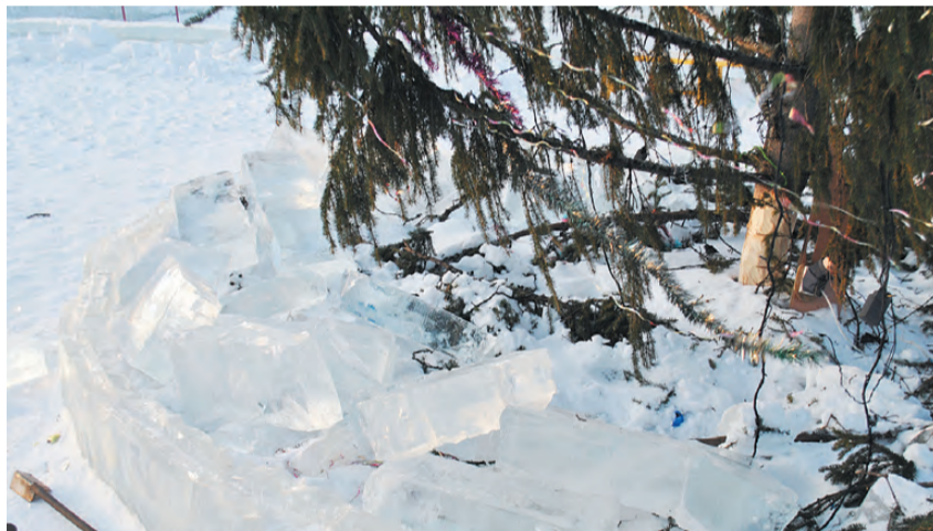
Создатели городка искренне не понимают, почему так сложно оказалось сохранить его для детей.

Минувшие новогодние праздники оставили о себе уже только воспоминания. По единогласному признанию режевлян, самым красивым местом в нашем городе этой зимой стал ледовый городок в зоне отдыха «Нептун». Организованная «Боевым братством» ёлка удивила многих, давно не было в Реже такого яркого, оригинального ледового городка.