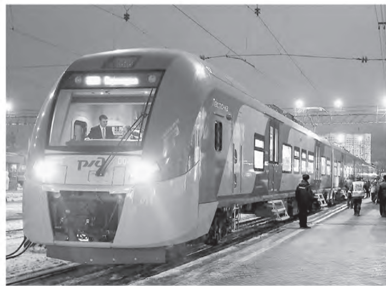
Скоростная «Ласточка» увеличит число желающих посетить святыни. В связи с этим губернатор оценил перспективы реконструкции верхотурского вокзала в рамках программы «Духовный центр Урала». Здание вокзала, возведенное в 1903 году, является памятником истории и культуры.

Губернатор Евгений Куйвашев во время крещенской поездки до Верхотурья отметил, что сегодня важно, чтобы жителям северных территорий – Нижнего Тагила, Верхотурья, Новоуральска – было комфортно добираться до Екатеринбурга и обратно. Благодаря новому электропоезду «Ласточка» увеличится пассажиропоток и бизнес-сообщение, будет дан импульс для роста экономики, инфраструктуры и качества жизни.