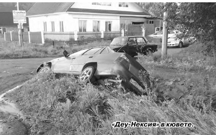
«Деу-Нексия» в кювете.