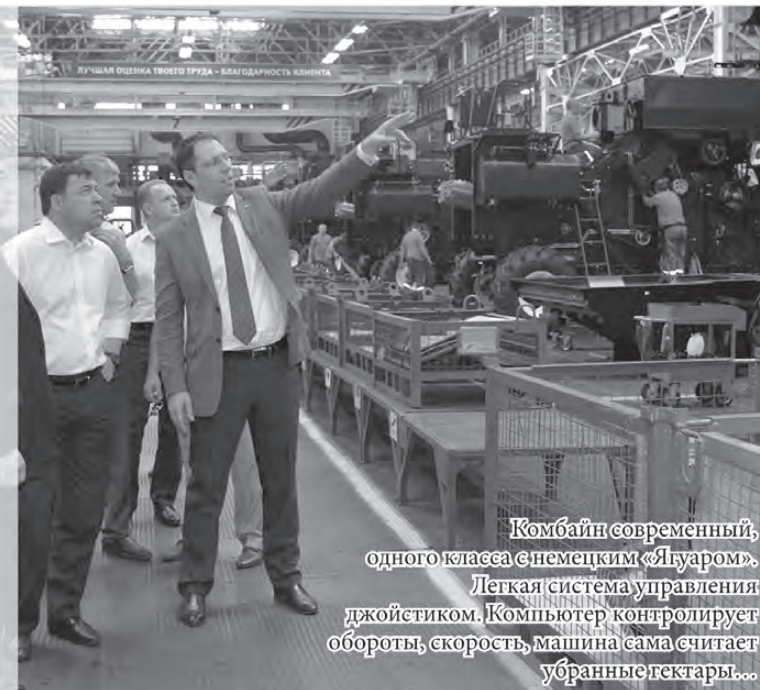
Комбайн современный, одного класса с немецким «Ягуаром». Легкая система управления джойстиком. Компьютер контролирует обороты, скорость, машина сама считает убранные гектары...