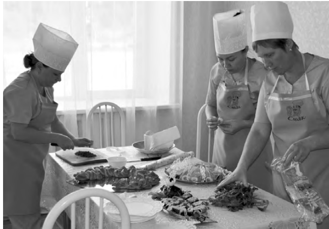
Команда «Смак». Последние приготовления.