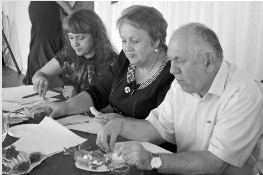
Ох, и вкусная это работа!