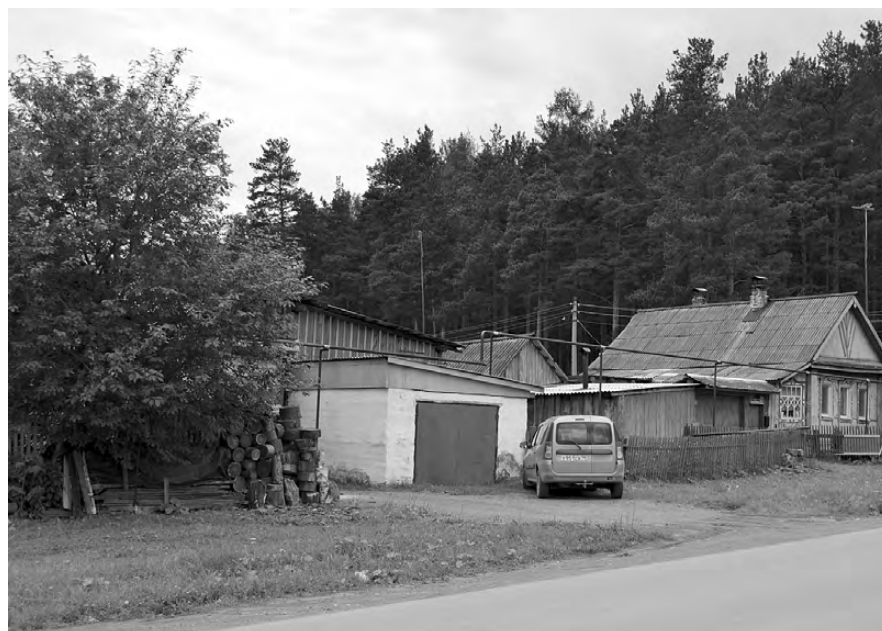
Газифицируется частный сектор микрорайона Быстринский.