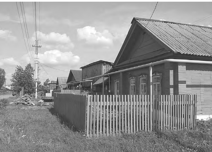
Газ пришёл в Кочнево.

Объект переходящий, строительство рассчитано на 2 года. Общая стоимость строительства превышает 12 миллионов 498 тысяч рублей. Финансирование на этот год составляет порядка 10 с половиной миллионов рублей. Из них 2 миллиона 446 тысяч рублей – средства федерального бюджета, 7 миллионов 577 тысяч – областные субсидии. Финансирование из местного бюджета – 424 тысячи рублей. Уже прошёл аукцион, определён подрядчик – ОАО «Газстройсервис». В ближайшее время начнётся строительство. В следующем году газопровод будет введён в эксплуатацию.